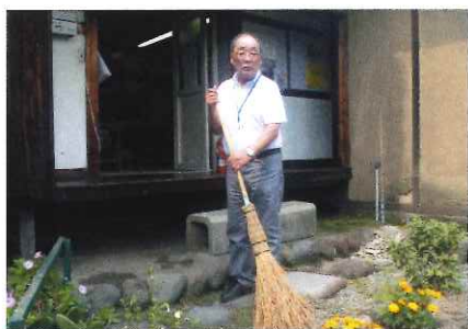
清掃する大手会員

就業日は毎週月曜日を除く毎日。就業時間は八時半から十七時までで、三名の会員が毎日ローテーションで就業しています。