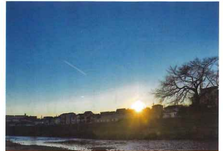
初日の出 星野 泰一 会員