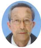
志木市 小尾 岬

昭和四十一年春、笈を負うて故郷を後にしてから早六十年近くを閲しようとしている私は、日本百名山の二つ、八ヶ岳山麓の長野県は諏訪郡豊平村で生を得ました。今の茅野市です。