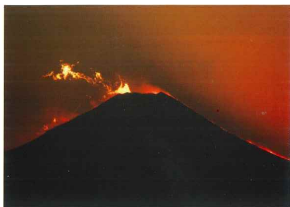
「燃える富士山」 黒田 茂会員