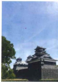
熊本城(国の重要文化財) 大天守閣、小天守閣、左から土櫓

雄大な阿蘇山や紺碧の海、天草、熊本城の勇姿、そしてグルメも喜ぶ熊本の旅は本当に「よかですばい」。是非一度訪れてください。