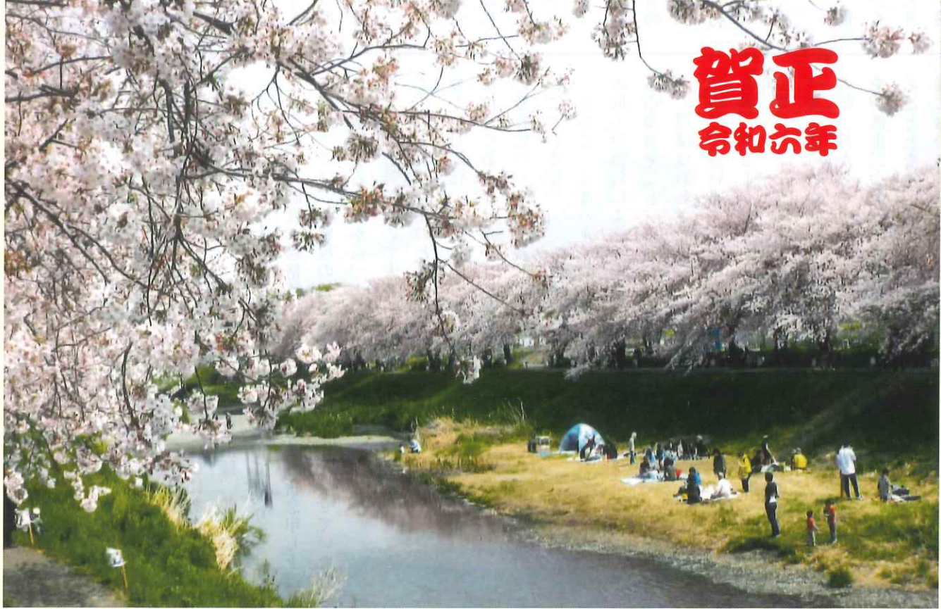
朝霞市「黒目川桜堤」