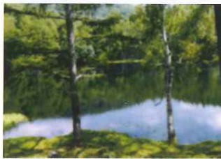
北八ヶ岳の中腹にある御射鹿池(みしゃかいけ) 東山魁夷「緑響く」のモチーフとなつたとされている