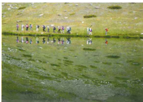
「スイス シュテリー湖 ハイキング」 田中 倫子会員