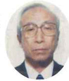
朝霞市 南 岑夫

江戸時代に肥後の国、今は「火の国」といわれる阿蘇、天草、そして市民のシンボル熊本城のある熊本が私の故郷です。