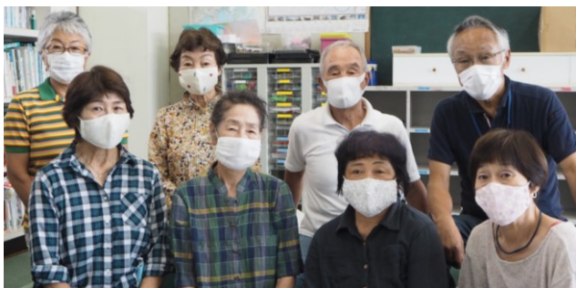
<筑波小児童クラブの皆さん>