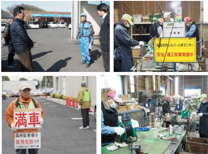
巡回指導 (昨年度の様子)

安全・適正就業委員会では、毎年、会員の就業先を巡回し、現場の整理整頓、安全保護具着用の徹底、健康管理、交通事故の防止及び熱中症予防対策など、委員による指導を行っています。特に、重篤事故につながりやすい庭木の剪定作業や除草作業の現場を丹念に巡回しています。 令和元(2019)年度は、延34箇所を巡回し、67人の就業会員の指導点検に当たりました。