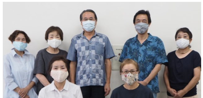
<けやき小児童クラブの皆さん>