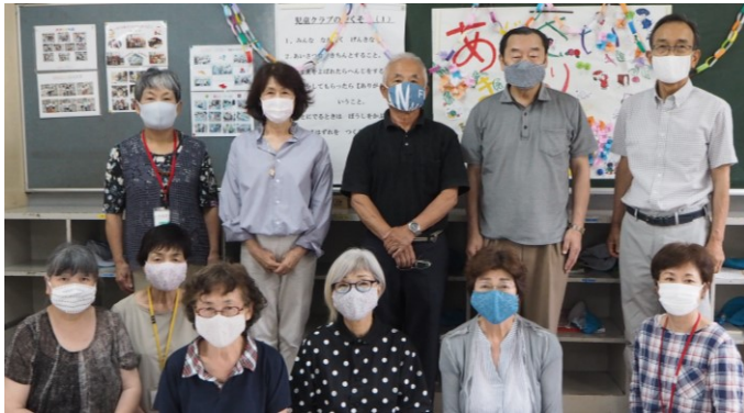
<三重小児童クラブの皆さん>