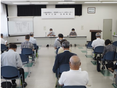
最小限の参加者による定時総会