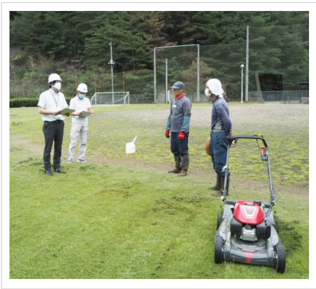
<刈払機を使用した除草作業の指導の様子>