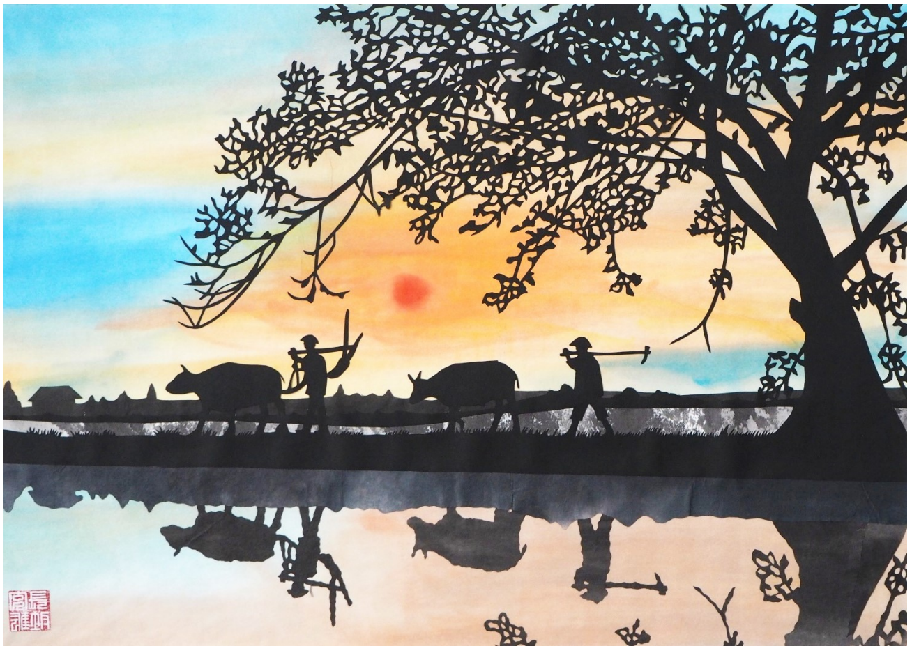
「切り絵」 作 長坂充雄理事（西部地区）