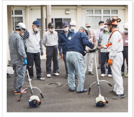
<刈払機取扱いの説明を受ける講習者>

令和2年10月13日に当センターにおいて「刈払機安全取扱」の講習会が開催され、受講された10の方が入会しました。