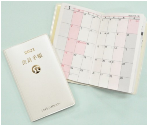
2021年版 会員手帳 1冊 200円

仕事の予定を管理するのに便利！ 残り部数がわずかです！ 希望される方はお早めどうぞ！