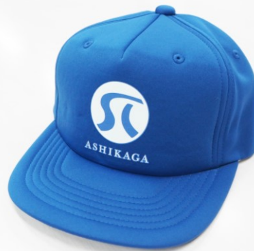
会員用帽子 1個 800円