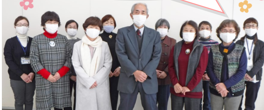
マスク姿ですが、、理事長を囲んで女性部会発足の記念撮影♪