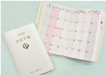
写真の会員手帳は令和3年版です。

令和4年版会員手帳の予約を受け付けます！ 月別カレンダーにメモ欄と備忘欄を設け、見やすく使いやすい手帳です。今年度より購入希望者のみの販売になります。