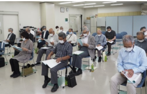
議長団の方々（上） 総会会場風景（下）