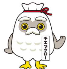
チエブクロは シルバー人材センターの マスコットキャラクターです