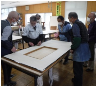
真剣な表情で 受講中！！