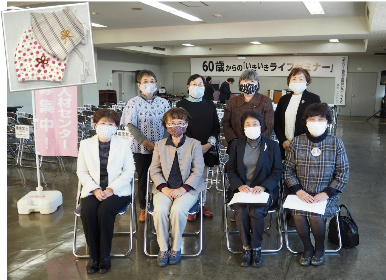
精力的に活動中の女性部会「シルモア」部会員とシトラスリボン付き布マスク（詳しくは6ページ）