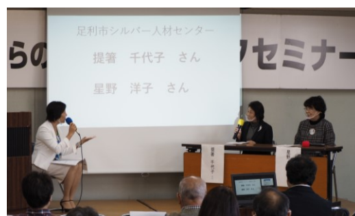
〈就業体験を話す提箸部会員と星野部会員〉