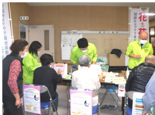
【肌年齢・骨健康測定】