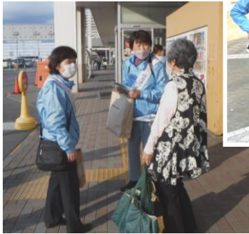
〈お揃いのチエブクローブルズンを着用しセンターをPR〉