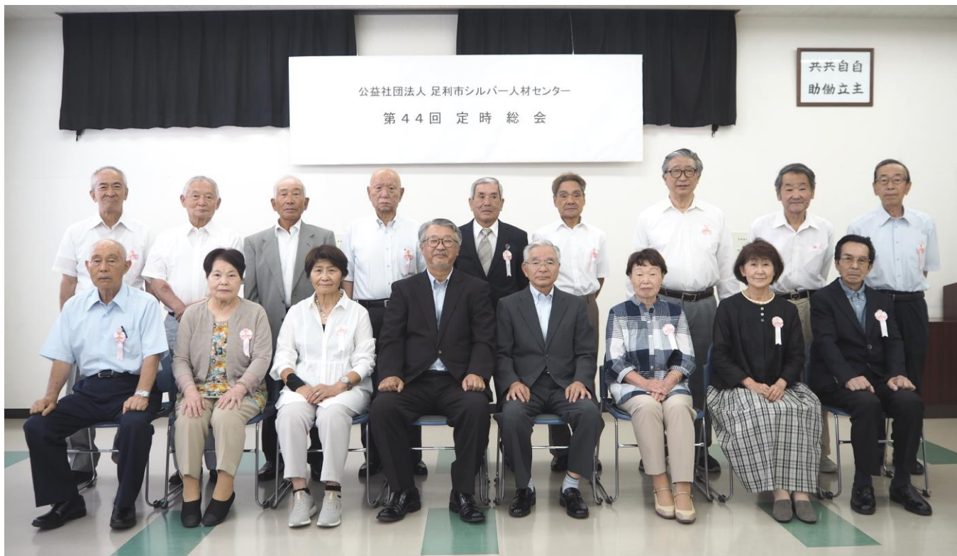
第 4 4 回定時総会理事長定期表彰受賞者のみなさんと森田理事長並びに川島前理事長