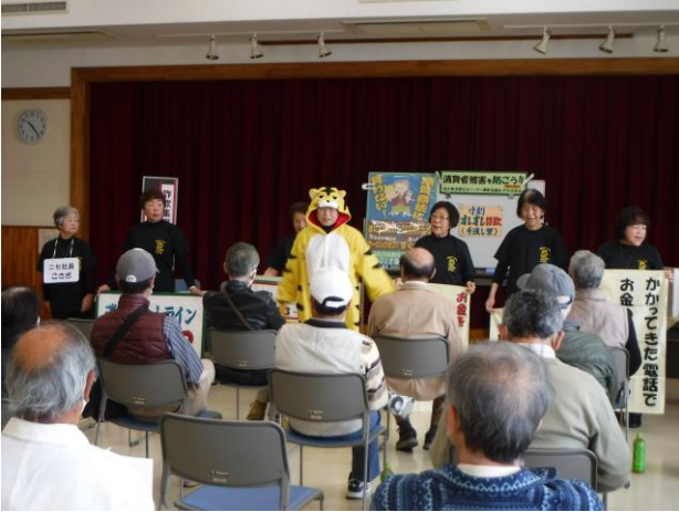
虎の子守り隊による「寸劇で学ぶ悪質商法の手口」(山辺・南部地区合同地区懇談会)