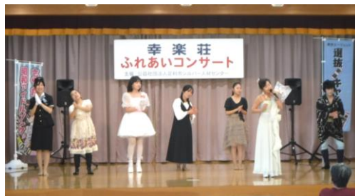
【東幸楽荘 歌謡オンステージ】

サークル発表、作品展示、お楽しみ抽選会、売店出店等を予定しています。詳しい情報はSMSやホームページでお知らせします。ぜひお越しください。