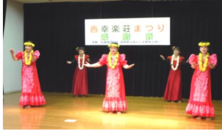
サークルのステージ発表

令和6年11月7日から27日まで各幸楽荘で幸楽荘まつりを開催しました。期間中は趣向を凝らした催し物等を行い、大勢のお客様にお越しいただきました。