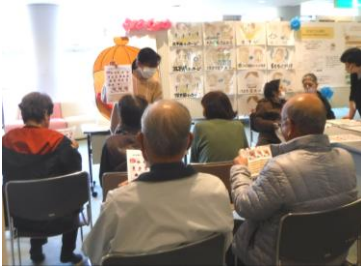
のどの筋トレ体験教室