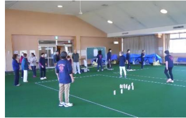
モルック体験教室