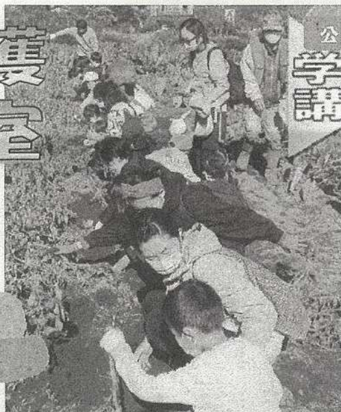
▲昨年のジャガイモ収穫の様子