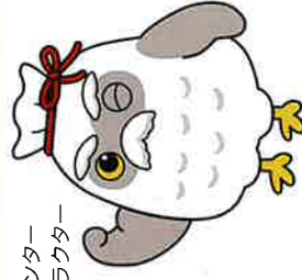
シルバー人材センター マスコットキャラクター 「チエブクロー」