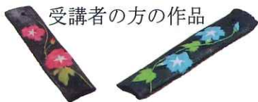
受講者の方の作品