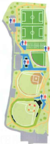
⑨綾瀬スポーツ公園 (トイレ配置)

本地図は、会員の皆様がセンターから仕事の紹介を受けて仕事に就く時に、事前にトイレの所在を把握することが出来るように作成したものです。今回は第2回目として(深谷／落合北／本蓼川)編を作成しました。順次続編を紹介していく予定です。