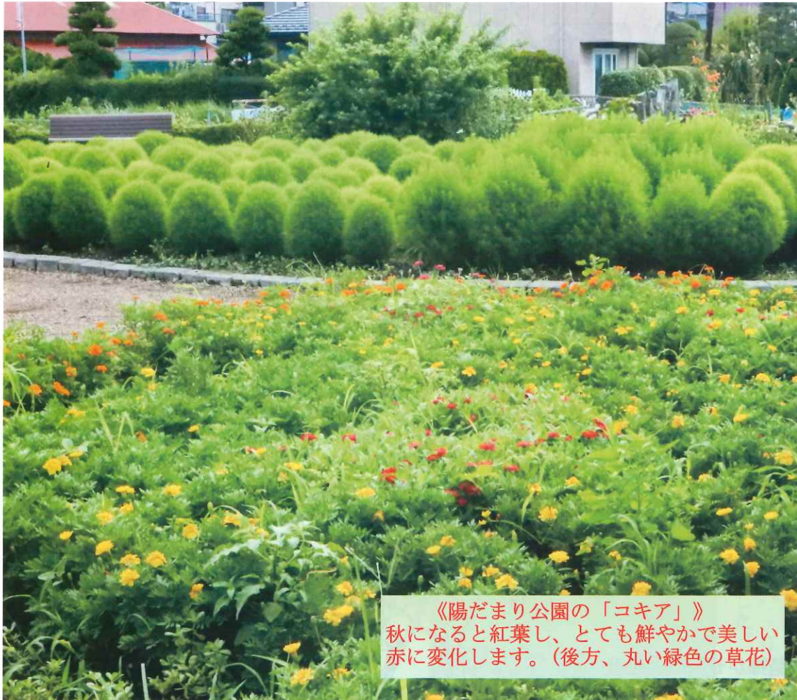
《陽だまり公園の「コキア」》 秋になると紅葉し、とても鮮やかで美しい赤に変化します。(後方、丸い緑色の草花)