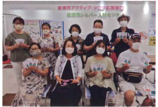
完成作品を持って記念撮影

生徒さんにはポチ 袋3枚に書いてもら いました。どれも ほほえましい顔にな っていました。