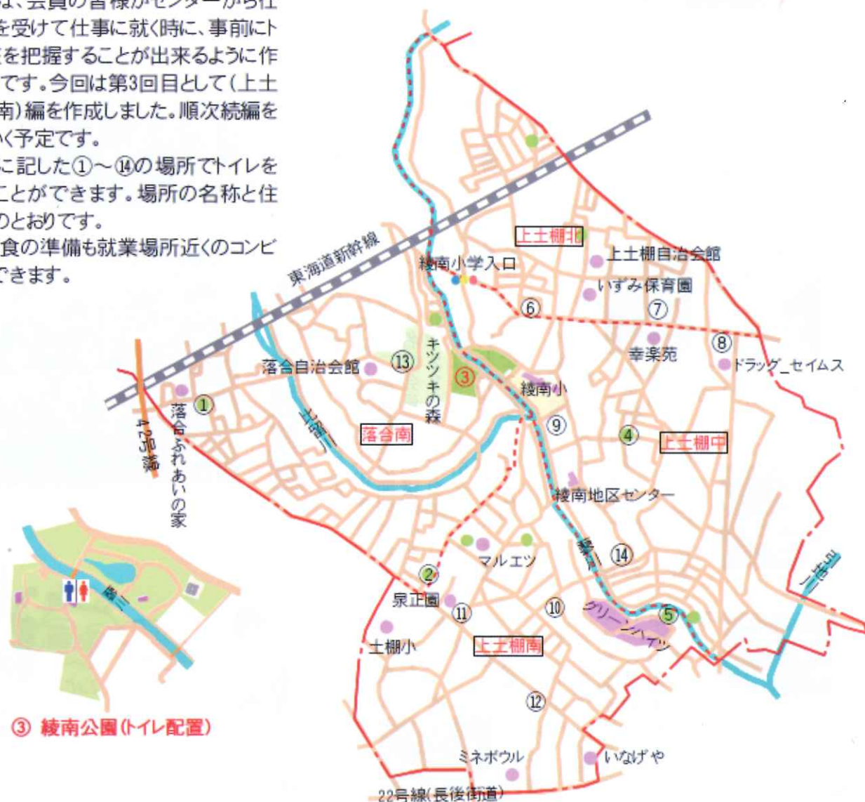
③ 綾南公園(トイレ配置)