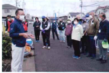
笠間理事長ご挨拶