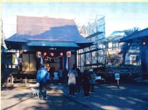
熊野神社の初詣

開催や、綾瀬タウンヒルズショッピ ングセンターにおいて、貴センタ ーとともに開設しておりますアクティ ブ・シニア応援窓口を通して、趣味 サークル、ボランティア等を紹介、 マッチングを図るなど、コロナ禍に あっても、より多くの高齢者が元氣 に社会参加できるよう、引き続き取 組みを進めてまいります。