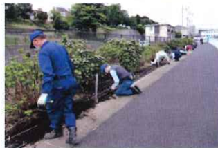
植え込み作業状況