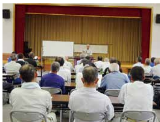
草刈安全講習会の様子

今後につきましては、絶対事故を起こさないという意識を持って就業に望んでいただきたいと思います。