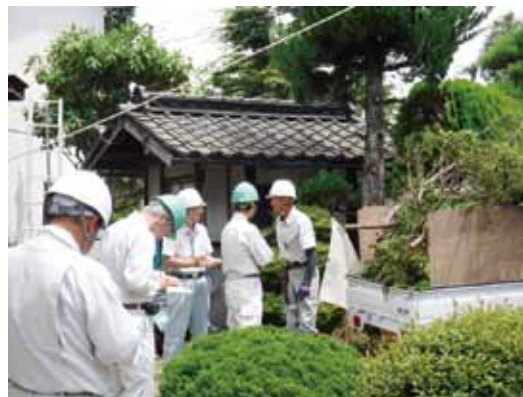
パトロールの様子

出されました。暑い時期になるので水分補給等体調には十分配慮するよう意見も添えられました。全会員が常に安全就業に意識を持ち取組みをお願いします。