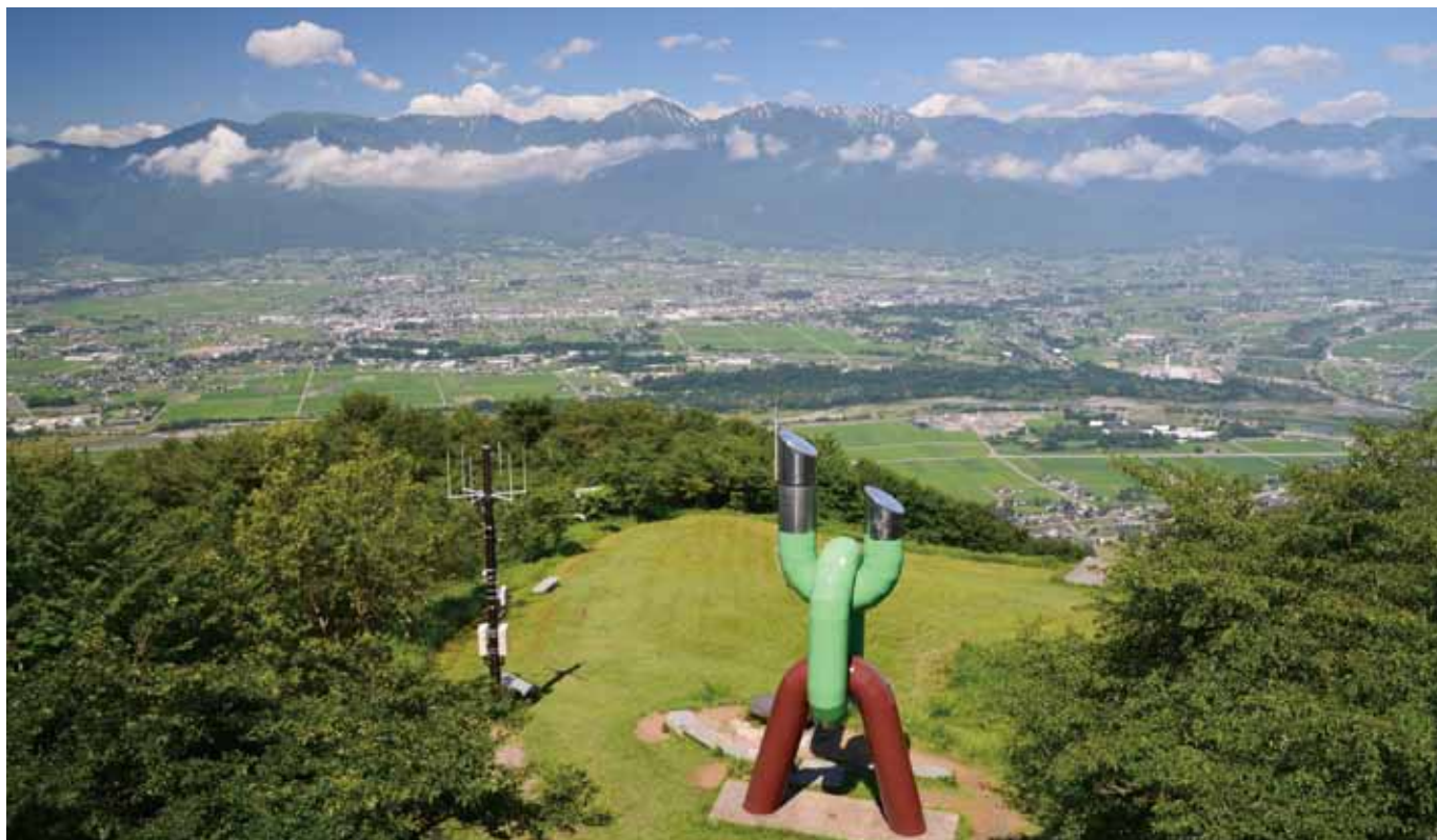
長峰山から安曇野を展望

第 57 号 平成 30 年 8 月 1 日 発行 公益社団法人 安曇野シルバー人材センター 住所 安曇野市豊科 4155-1 TEL 0263-72-5800 FAX 0263-73-6484