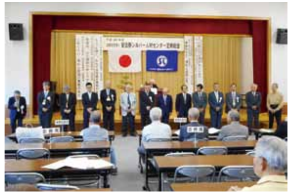
選任された理事・監事の皆さん 任期平成32年の総会まで