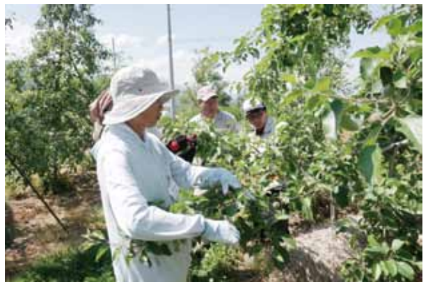
講習会を受講されている皆さん

県シルバー人材センター連合会から委託を受けた技能講習会「果樹農園スタッフ講習会」を5月17日から3日間開講し7人が受講しました。シルバー会員のスキルアップ、新規会員の発掘を目的に開催されました。技能講習ではJAの果樹技術員、県農業改良普及センターの方から、摘果の講習が半日単位で2日間行われました。受講された皆さんは既にりんご農家の戦力として就業しています。