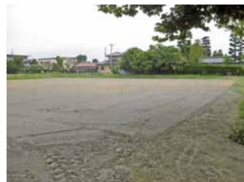
たまねぎ栽培予定地：三郷地区

ております。今年度約50アールを借りうけ、たまねぎ、野沢菜、ほうれん草栽培に取り組みます。専門知識をもったコーディネーターを配置し、地域の子どもや一般市民を対象にした講習会なども実施して高齢者の健康づくりや生きがい作りに繋がります。また、子どもたちが植え付けや収穫を体験することで農業の面白みを知ってもらい農業の活性化につなげます。 たまねぎ、野沢菜、ほうれん草などの苗の育成、植え付け、除草、収穫などの作業を行い、会員の就業拡大や会員の拡大を図ります。また、ビニールハウスを設置して冬場の野菜栽培にも取り組めます。