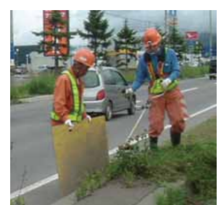
ベニヤ板で飛石防止

当シルバー人材センターでは、昨年度、草刈り作業時に、飛び石による事故が、多発しました。このような事故を防止するため、道路沿い、施設等の近接作業時には、ベニヤ板などで、飛石防護対策をお願いします。最新の注意で、事故ゼロを目指しましょう。