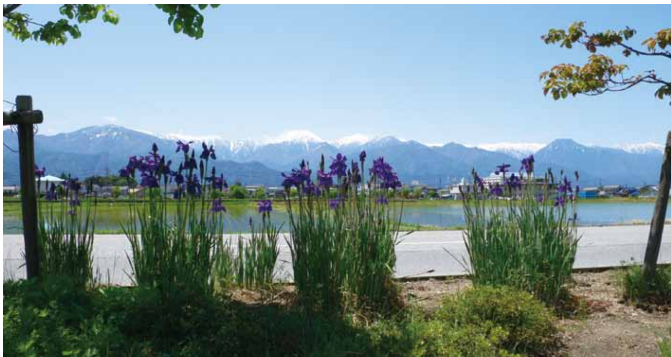
あやめ（総会会場から北アルプスを望む）

安曇野市豊科5126-1 TEL 0263-72-5800 FAX 0263-73-6484