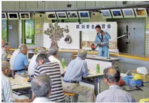
講義による基礎知識の習得

刈払機は、誰でも容易に入手でき、手軽に使用できることから、全国的に毎年、傷害事故、賠償事故が多く発生している作業機械です。当センターで昨年度発生した賠償事故5件のうち4件は、刈払機による事故でした。 このため、安全な作業に必要な知識と技術を習得していただく