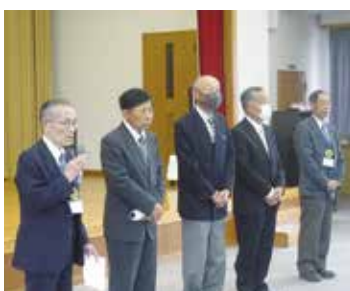
退任された役員の皆さん

最後に安曇野シルバ－人材センターの発展と皆さま方のご健勝をご祈念申し上げて、退任のごあいさつといたします。