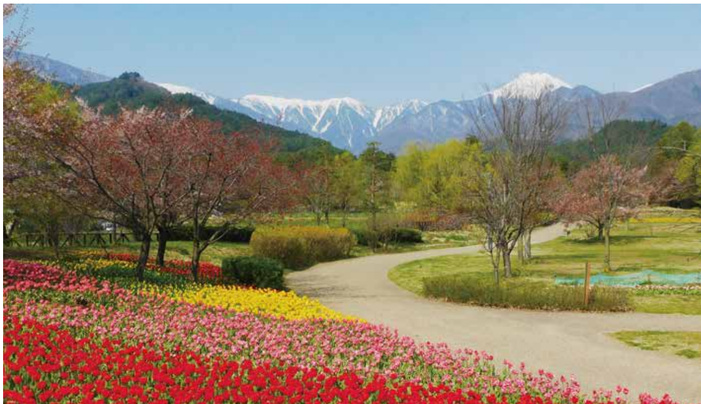
国営アルプスあづみの公園（堀金・穂高地区）に咲く色とりどりのチューリップ

第61号 令和2年8月1日 発行 公益社団法人 安曇野シルバー人材センター 住所 安曇野市豊科 4155-1 TEL 0263-72-5800 FAX 0263-73-6484