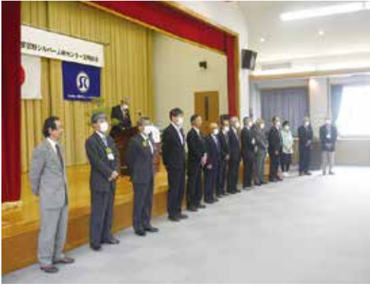
新任された役員の皆さん