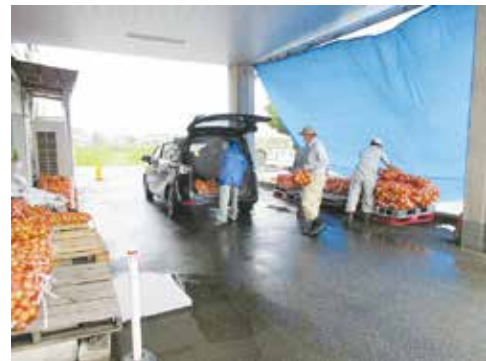
ドライブスルー②～積込場所～