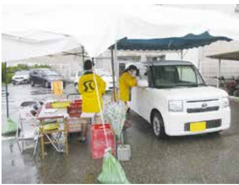
ドライブスルー① ～受付・会計～

今回は、新型コロナウイルス感染症防止のために初めての「ドライブスルー方式」を採用しました。