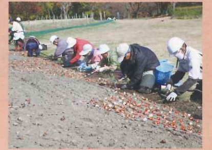
チューリップの植付け作業