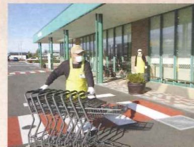
カート回収作業（派遣）