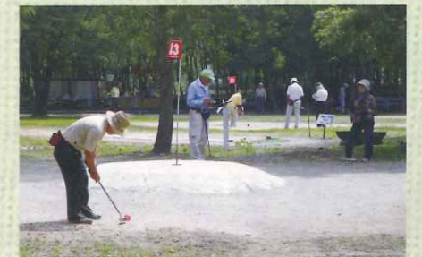
マレットゴルフ大会