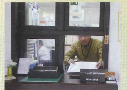
施設管理（窓口）業務