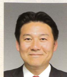
別府市長 長野 恭紘