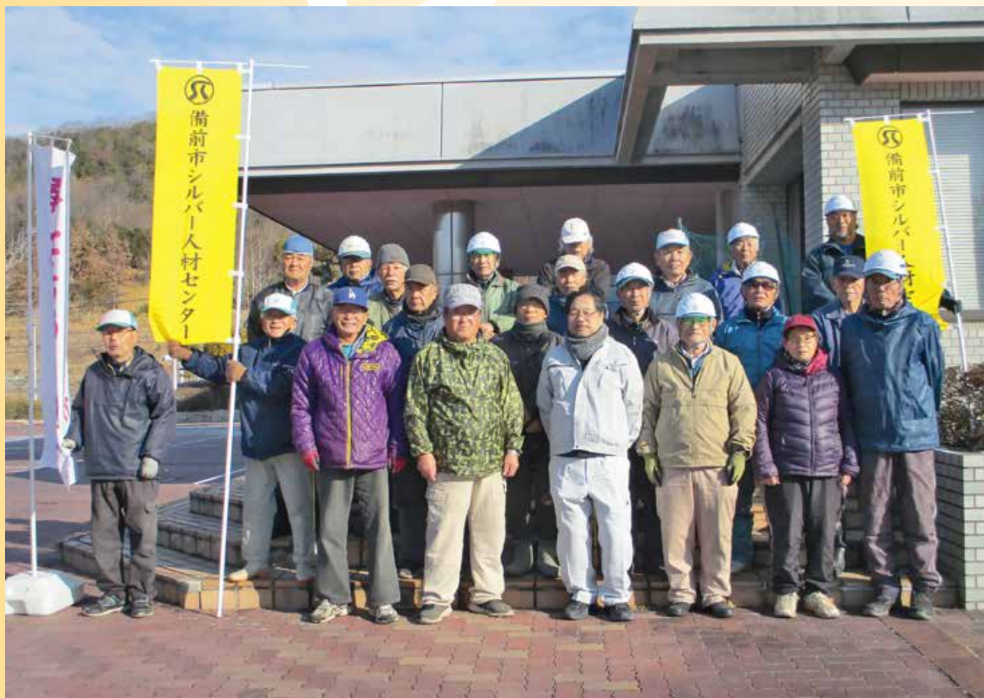
ボランティア活動 in 備前市チオビタ運動公園