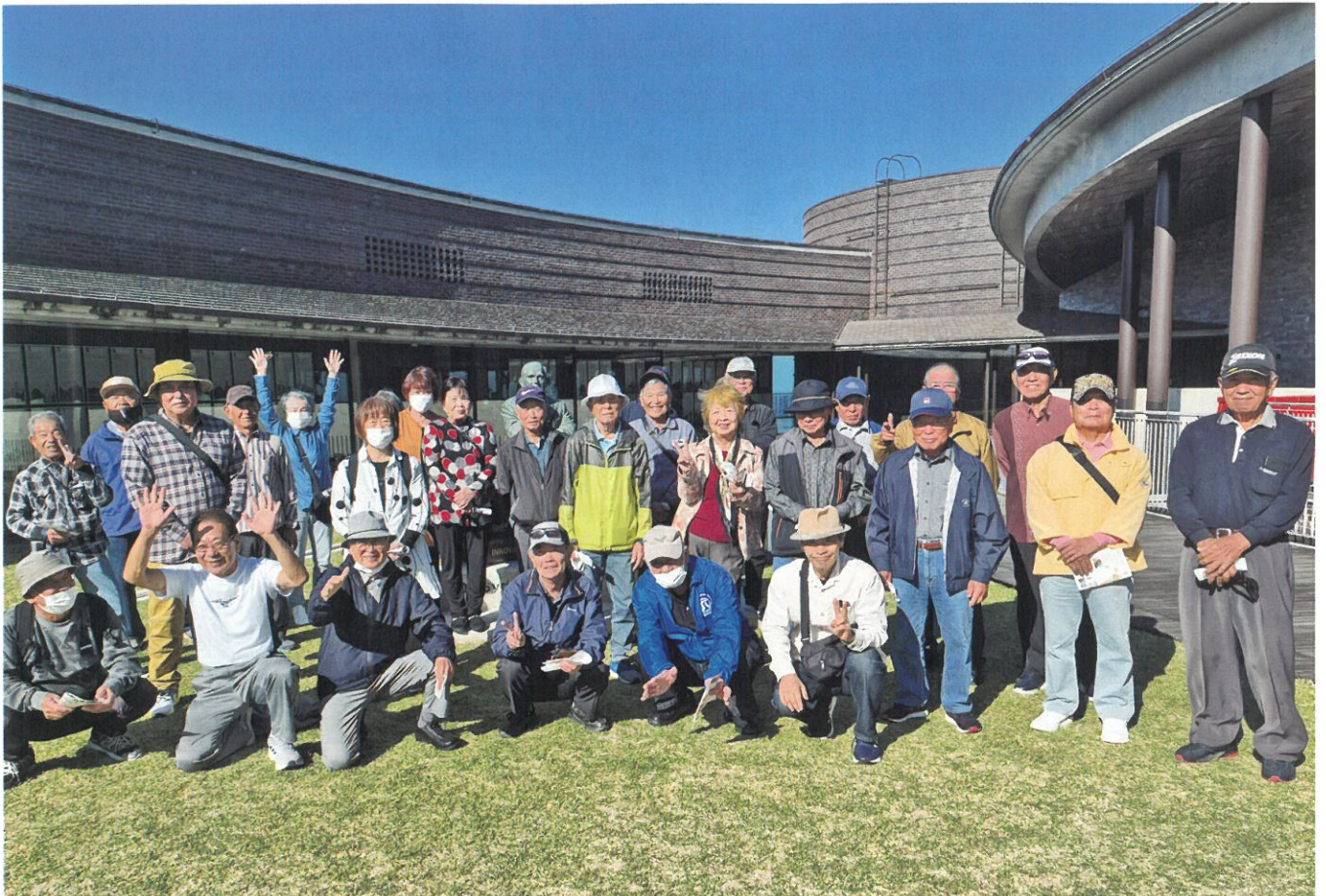
令和7年度会員研修旅行