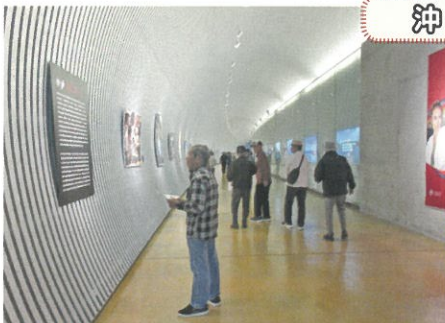
沖縄科学技術大学院大学