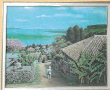
ほのぼの宮城島集落

「と心の中で叫び、期待以上の結果に驚いた。」 国立新美術館で開催される日美展で作品を展示する旨の案内があり、妻を同伴し会場に向いた。国立だけに壮大な内外観のたたくまいに圧倒された。会場内に入ると、全国から応募された力作が多数展示され、そのスケールの大きさに目を見張った。同じくして、展示された自分の作品を見る複数のグループに目が留まった。「わー、沖縄の風景だ!」という声が聞こえた。ふと「沖縄のアピールに貢献できたかな?」と想像し、ホックリ気分分会场を後にした。