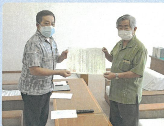
亀谷議長への要請