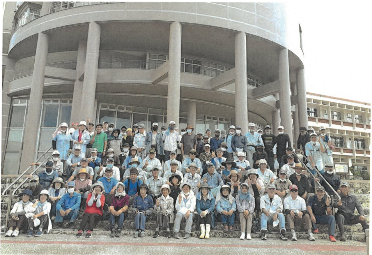
令和4年10月15日「シルバーの日ボランティア清掃」