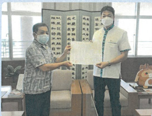
渡久地町長への要請

令和4年8月18日(木)に、シルバー事業のさらなる発展へ向けて、令和4年度公益社団法人全国シルバー人材センター事業協会定時総会決議を携えて、北谷町長及び北谷町議会議員長へ『「生涯現役社会」を実現するシルバー人材センターの決意と支援の要望』として要請行動を実施しました。