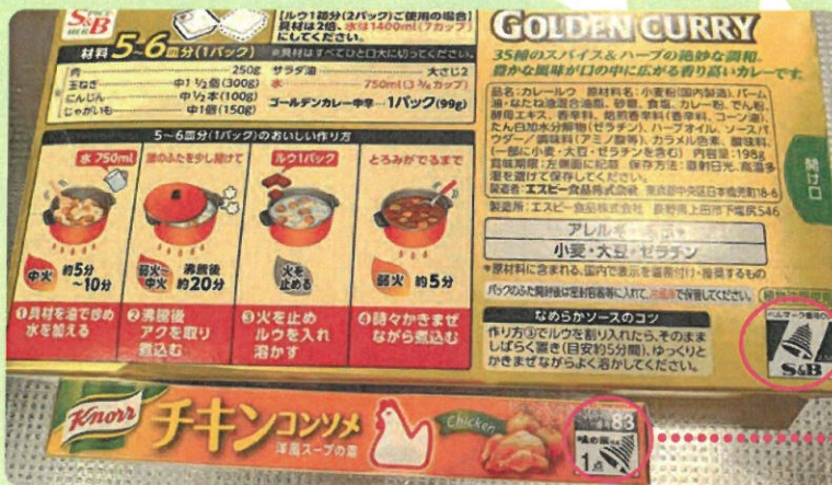
(例：カレールー、コンソメなど)