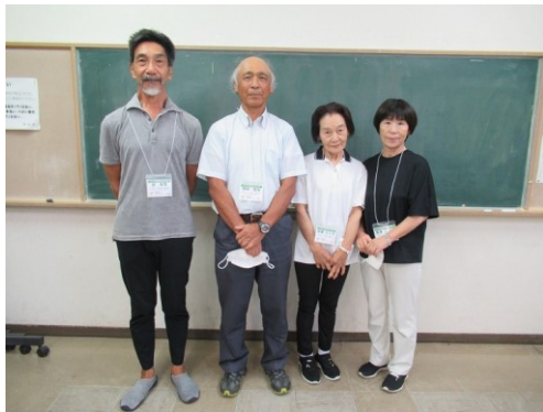
新サポーターのみなさん よろしくお願いします！

7月29日から始まったフレイル予防教室サポーターの養成講座が3日間、6回のプログラムを経て終了しました。このプログラムを修了し、今回新しくサポーターになったメンバーは4名です。新しい仲間が増え、今後、より教室を盛り上げていきますので、よろしくお願ひします。