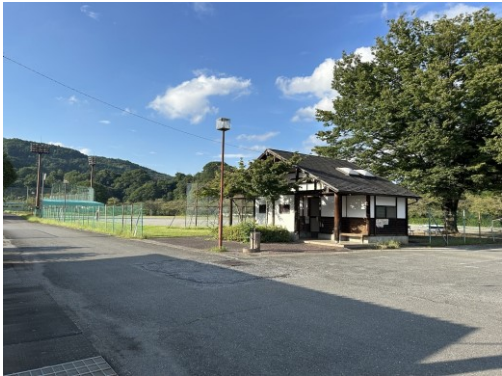
植栽整備等を受注している 荒川総合運動公園

従来の草刈機の方式とは全く異なるやり方で除草するので、石飛等の事故を防ぐことができます。価格面などの課題はありますが、今後が期待されます。