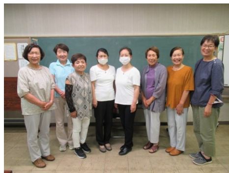
完成！みなさん、より一層 綺麗になりました！

ワイワイ、キャツキャと楽しい声が会場に響きわたる中、講師の方からプロのメイク術を教えていただきました。