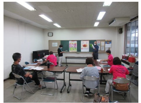
教室の進め方を 実習を交えて学びます