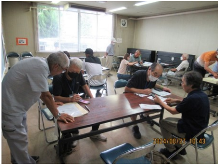
デジタル委員のメンバーが丁寧に教えてくれます

8月末現在では、170名の方に登録いただいております。相談会は今後も定期的の実施しますので、登録がまだ済んでない方は、ぜひ相談会にご参加ください。