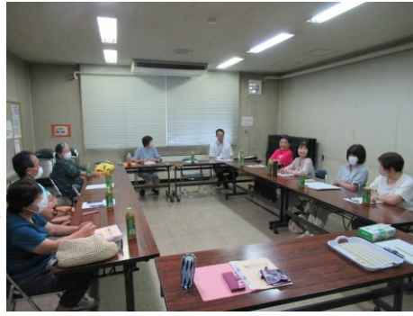
なごやかな雰囲気 情報交換をおこないました

8月30日(金)、ファミリー・サポート・センターの協力会員と担当課である秩父市子育て支援課の職員に集まっていただき、交流会を開催し、意見交換、情報交換を行いました。