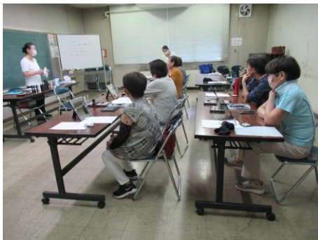
座学もおこない メイクの基本を学びます

8月28日の女性委員会において、今後開催を予定している「お化粧品教室」の模擬演習を行いました。当日は(株)ポーラから講師の方を招き、委員を中心として6名が受講者という形で行いました。