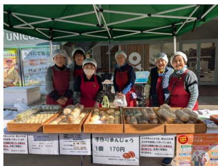
遊びに来てください お待ちしております！

3月1日開催の第1回は春うらの日和となり、会場は多くの人で賑わいました。売れ行きも好調で、まんじゅうは、お昼前に完売しました。