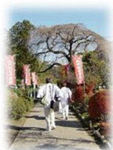
いまま変わらず つづく、巡礼 の営み