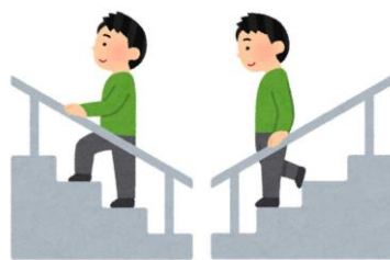
階段の昇降時は必ず手すりに掴まる

階段の昇降時は両手に荷物を持たず、片方の手は必ず手すりにつかまって昇降してください。また、可能であればエレベーターを使うようにしてください。