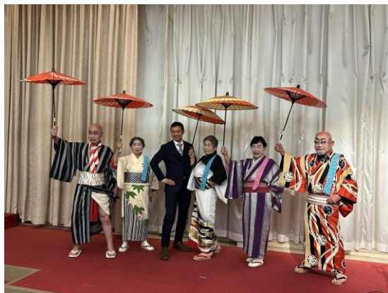
白波五人男と清野理事長

1月22日、親睦会新年会が盛大に開催されました。 宴のハイライトとなったのは、歌舞伎愛好会による「白波五人男」の披露です。堂々たる見得や鮮やかな衣装に、客席からは「待ってました!」と大きな掛け声が飛び交いました。