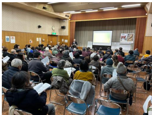
100名を超える参加者を迎え 会場は熱気に包まれました

12年に一度の「午歳総開帳」を目前に控え、ガイド班が企画した札所めぐり準備講座「34の物語」が、3月15日をもって全3回の日程を終了いたしました。