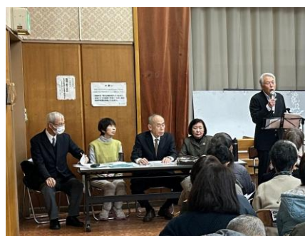
企画・運営・講師を務めた ガイド班のメンバー

のお話を直接伺える貴重な機会をありがとうございます。総開帳がますます楽しみになりました。総開帳がますます楽しみになりました。総開帳がますます楽しみになりました。総開帳がますます楽しみになりました。