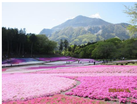
25周年を迎えた芝桜園地

就業された会員の皆様や普段から羊山、芝桜園地の整備を行っている皆様のおかげで、今年も多くの観光客や市民の方に芝桜を楽しんでもらえたと思います。大変お疲れ様でした。