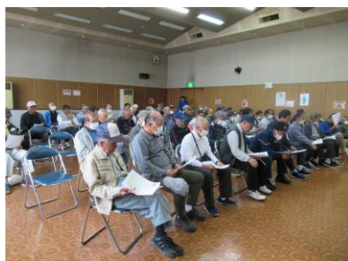
皆さん、熱心に受講 されていました

昨年度は会員の皆さまの安全に対する意識の高まりから、草刈機による事故は少ない年でした。新年度を迎え、参加された方は新たな気持ちで真剣に受講されていました。