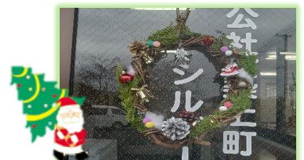
陽光学園おやまだ様から頂いたリース

今年度もボランティア活動や講習会にご参加頂きありがとうございました。また、今年も暑い中、寒い中での就業 大変お疲れ様でした。そんな中、お客様から会員さんの丁寧な仕事にお褒めの言葉、温かいお言葉を頂きました。嬉しさで心が震えました。皆様ご自愛頂き、また、たくさんの笑顔が見られることを楽しみにしています。