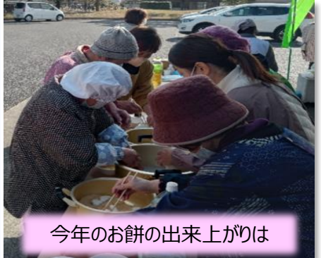
今年のお餅の出来上がりは