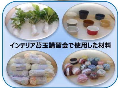
インテリア苔玉講習会で使用した材料