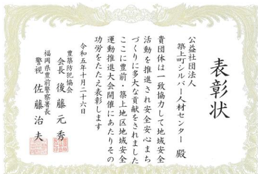
地域安全活動推進表彰

令和五年度は安全・適正就業委員会による安全パトロールを十二回計画しました。パトロールの項目は、人通りが多い場所での看板・コーンの設置・整備、防護ネットの使用、ヘルメット着用、道具の整理・整備を重点項目として実施しました。表彰としては、青色防犯パトロール講習を受講し活動を行ってきた結果として、築上町シルバー人材センターとして、豊前・築上地区地域安全運動推進大会にて表彰状を頂きました。