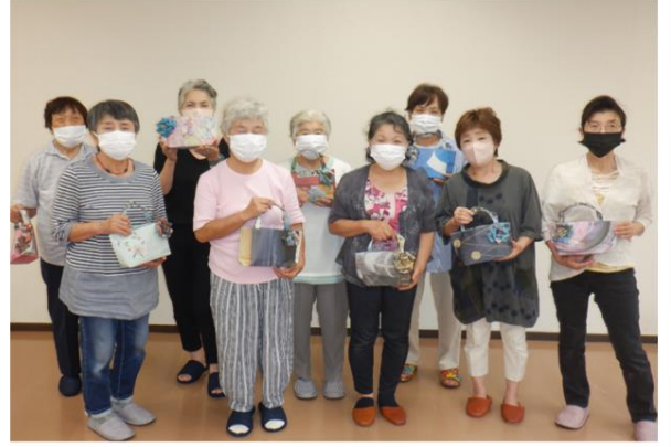
☆紙バッグ作り☆ 参加者それぞれの個性でバッグを作りました