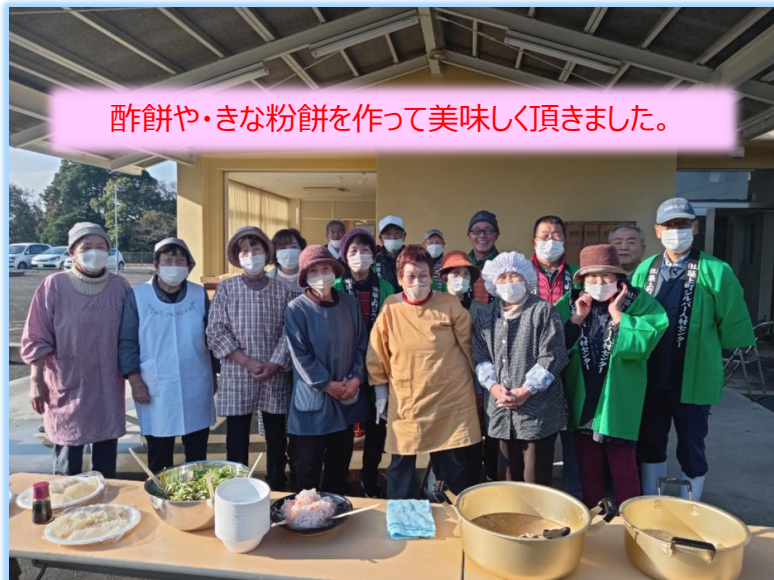
酢餅や・きな粉餅を作って美味しく頂きました。