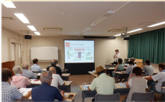
真剣な表情でスマホとにらめっこ