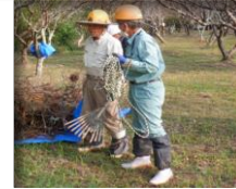
会員37名、事務局6名参加 たくさんの梅の剪定屑がありました、皆様のご協力で綺麗になりました。