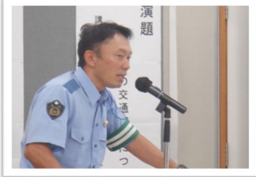
高齢者の交通安全について 講師：豊前警察署交通課交通指導課長