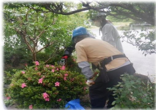
剪定現場 安全パトロール風景