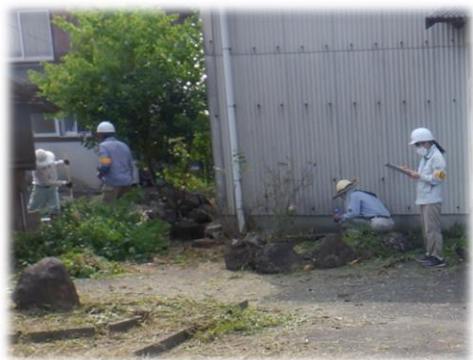
草刈り現場 安全パトロール風景

令和五年度は安全・適正就業委員会による安全パトロールを十二回計画しました。パトロールの項目は、人通りが多い場所での看板・コーンの設置・整備、防護ネットの使用、ヘルメット着用、道具の整理・整備を重点項目として実施しました。表彰としては、青色防犯パトロール講習を受講し活動を行ってきた結果として、築上町シルバー人材センターとして、豊前・築上地区地域安全運動推進大会にて表彰状を頂きました。