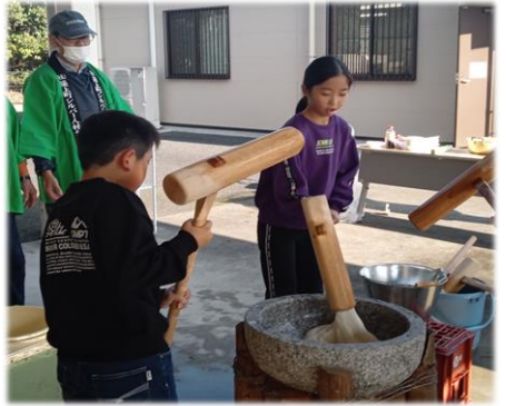
杵つきと合いの手のタイミングの良さに感動しました。