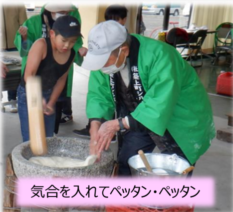
気合を入れてペタン・ペタン