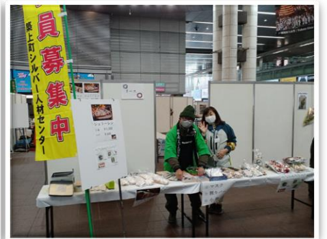
シルバーフェスタ北九州(小倉駅)