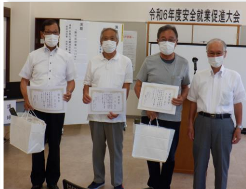
安全標語優秀作品の表彰