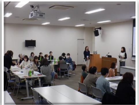
シルボヌ会員交流会(黒崎)