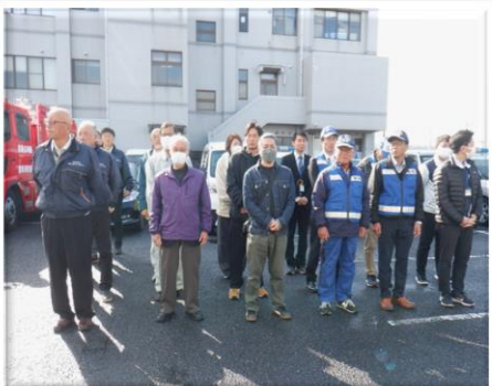
豊前警察署年末年始 特別警戒出発式