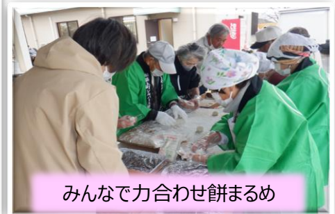
みんなで力合わせ餅まるめ