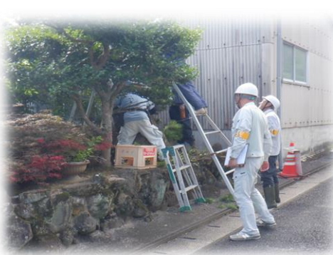
剪定安全パトロール風景

令和六年度は安全・適正就業委員会による安全パトロールを十二回計画しました。パトロールの項目は、就業前ミーティングの実施状況、作業中看板・コーンの設置、ヘルメット着用。草刈り作業は防護ネットの使用状況、剪定作業は脚立の開き止めと安全帯の使用状況を重点項目として実施しました。又、表彰としては、連合会の安全就業促進大会にて安全標語の部門で表彰状を頂きました。