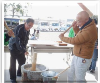
今年のお餅も美味しくなれと みんなで力合わせペタンコ