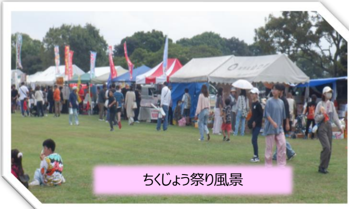
ちくじょう祭り風景