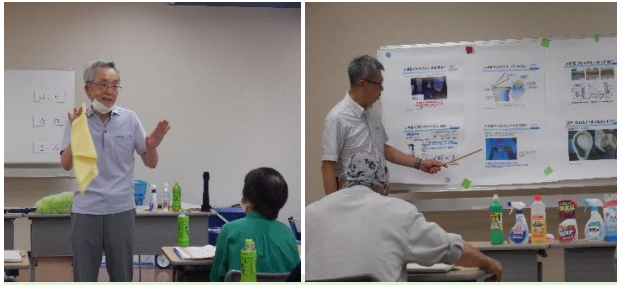
講師2名による講義 「清掃作業の知識」と「ハウスクリーニングの実務」