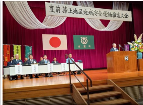
豊前・築上地区安全運動推進大会