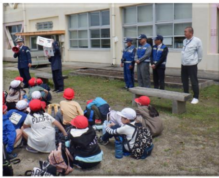
新1年生児童に対する防犯指導

豊前警察署・福岡県シルバー人材センター連合会等の依頼で様々な行事に参加しました。