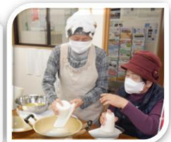
餅つき前の下準備