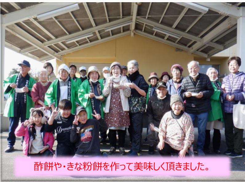
酢餅や・きな粉餅を作って美味しく頂きました。