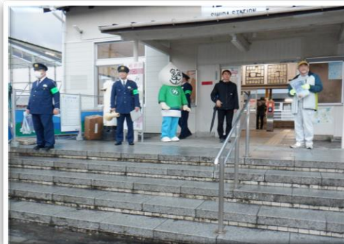
年末年始街頭キャンペーン(椎田駅)