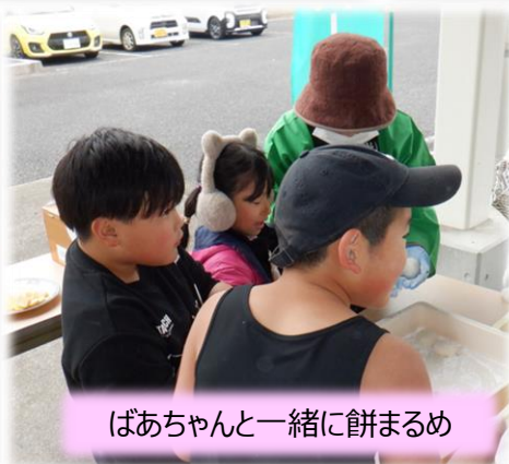
ばあちゃんと一緒に餅まるめ