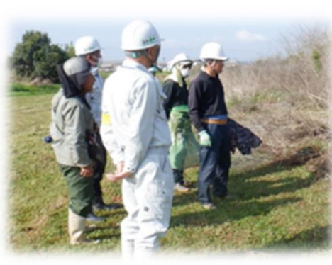
草刈り安全パトロール風景