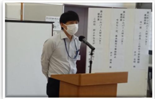
高齢者の交通安全について 講師：豊前警察署交通課交通指導係長