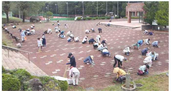
茅野市運動公園の体育館前広場にて