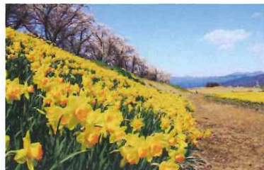
諏訪市 上川河川敷の水仙と桜

開催日時 5月31日(金) 午後1時30分～ 会場 茅野市民館 コンサートホール ※定時総会終了後、引続き会員互助会通常総会を開催します。