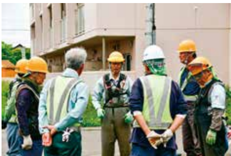
作業前のミーティング