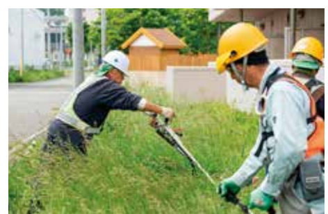
腰まで伸びた草を刈る