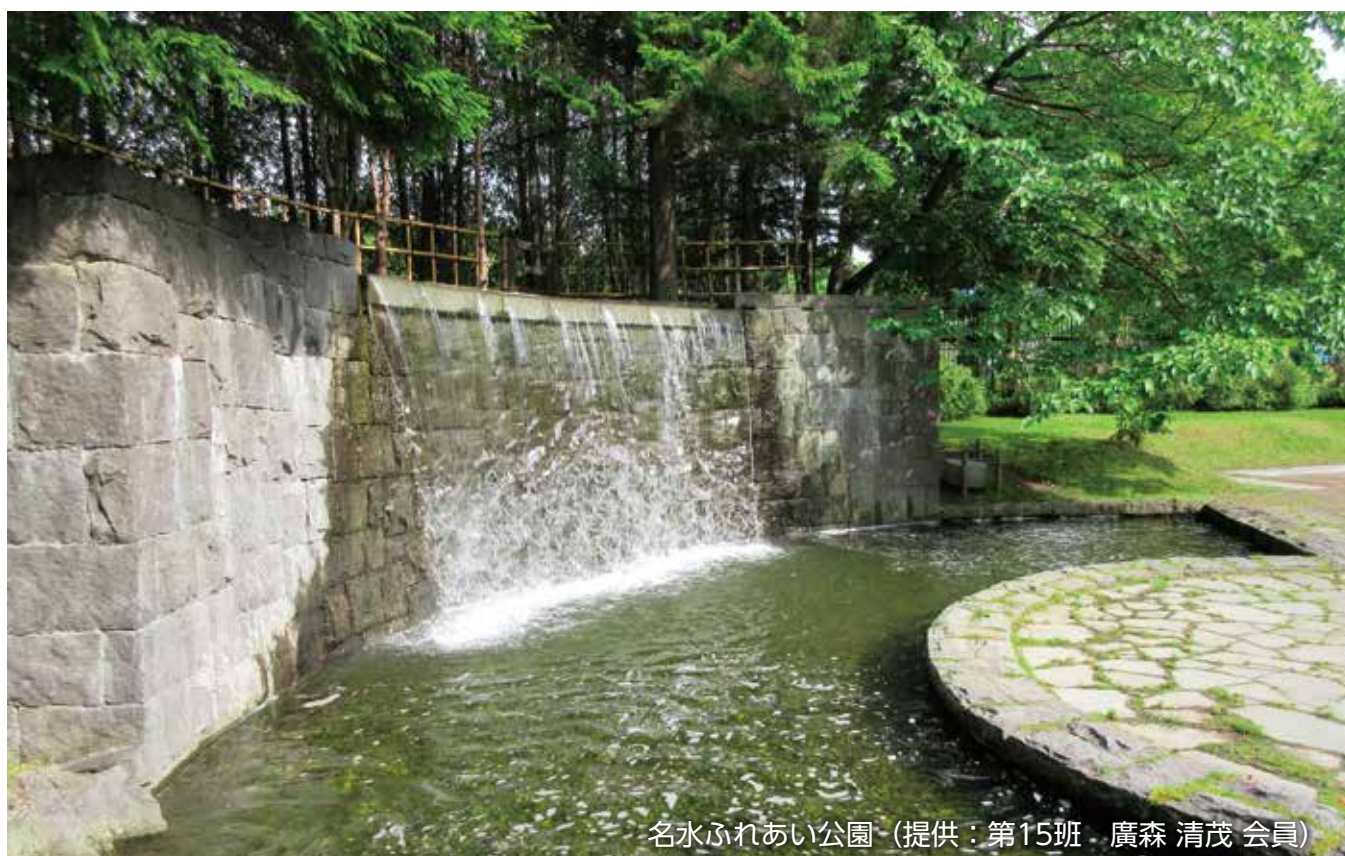
名水ふれあい公園