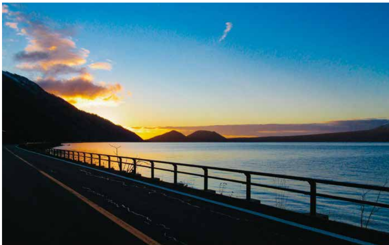
支笏湖の夜明け