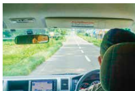
安全運転でバスを走らせる