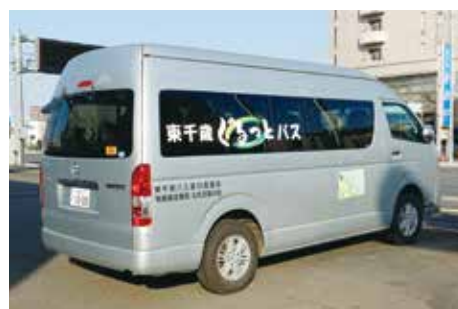
ロゴが存在を主張する