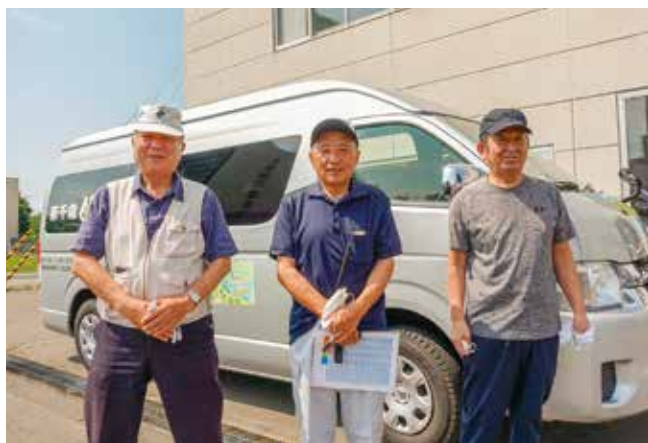
ドライバーの皆さん 左から古世会員、小池会員、山崎会員