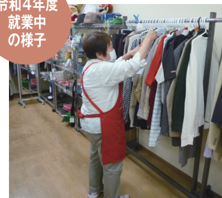
リサイクルハウスかざぐるま箱崎町