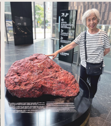
KABUTO ONE 1階 佐渡の赤石