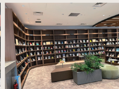
KABUTO ONE 3階 Book Lounge