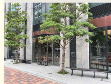
KABUTO ONE 1階 レストラン街