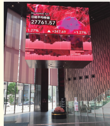
KABUTO ONE 1階 エントランス