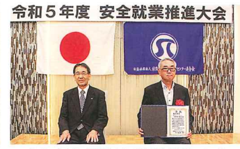
令和5年度安全就業推進大会