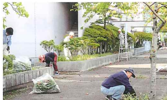
文化会館奉仕活動