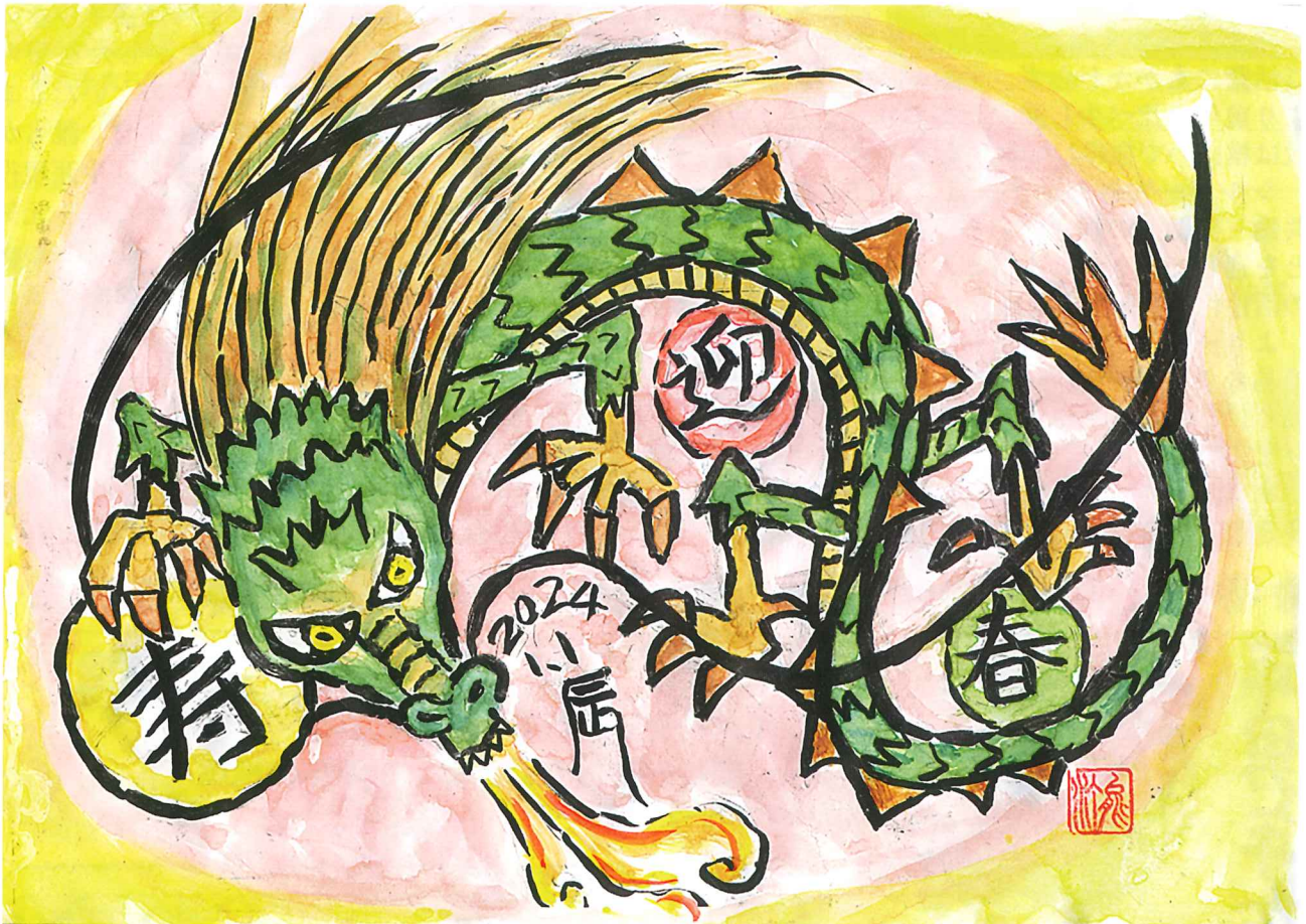
「長寿龍」 絵手紙 柴田テツ子 作