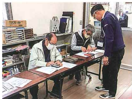
Smile to Smile 説明会