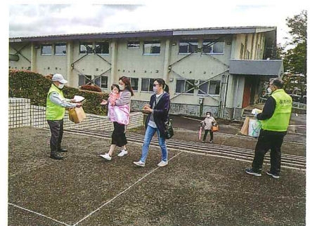
●のしろ産業フェア2023にて