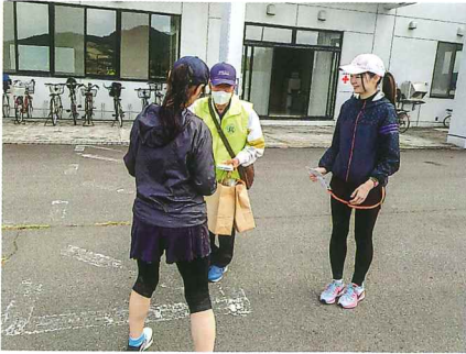
●きみまちニツ井マラソン会場にて

10月の「シルバー普及啓発促進月間」の取り組みとして、イベント会場等において会員拡大に向けたチラシの配布を実施しました。