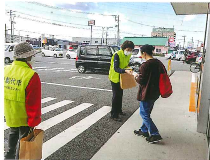
●テラタバイパス店様にて