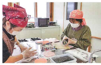
手巻き寿司講習会