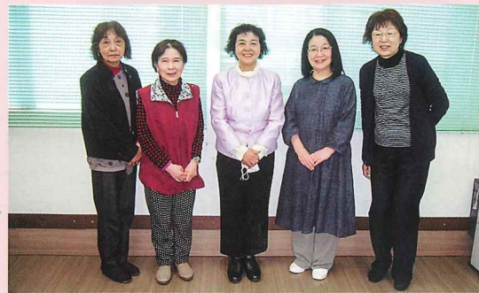
青山委員長を中心に、当日参加の皆さん