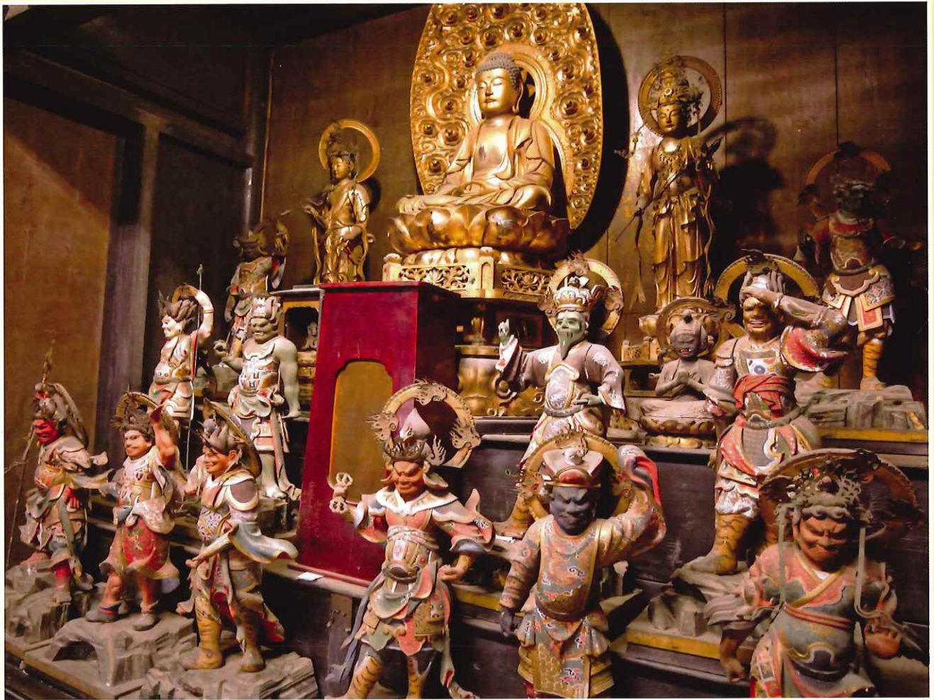
本尊薬師如来像、日光菩薩、月光菩薩、十二神将

発行／公益社団法人伊達市シルバー人材センター 福島県伊達市梁川町青葉町 3 番地 電話 024-577-6022 ホームページアドレス／ http://webc.sjc.ne.jp/dateshi/