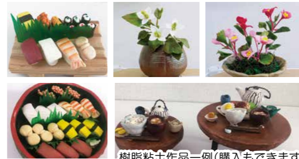
樹脂粘土作品一例(購入もできます)

毎週木曜日は、シルバー人材センター内で開催している樹脂粘土教室の講師として活躍されています。