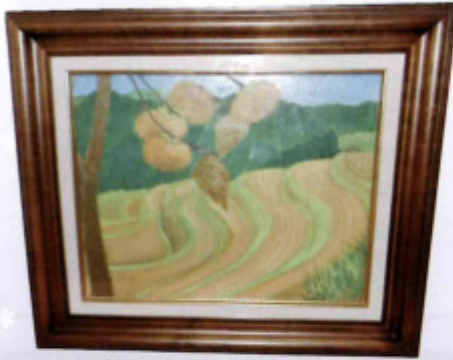
インツケイコク ワサフ 射添溪谷 和佐父の棚田 (兵庫県美方郡香美町村岡区)

私も福知山文化教室の「絵を楽しむ会」に入ってから四年、ある福知山の郵便局に、半年交代で絵を展示させてもらっています。ある日両親を介護されている人がやってきて、私の空の絵を見て「心が休まる」から、この絵をゆずってほしいと言われました。(絵を描いていて、こんな嬉しい事は初めてでした。)私のようなへたくそな絵を見て、何かを感じてくれる人がいるのに驚きました。それから、ますます絵が好きになりました。絵を描く事、それは最高の老化防止にもなるそうです。没頭する事によって、いつまでも若くいられる絵を描くことと、剪定の仕事はよく似ているように思います。