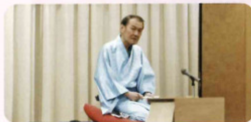
昨年のつどいの様子