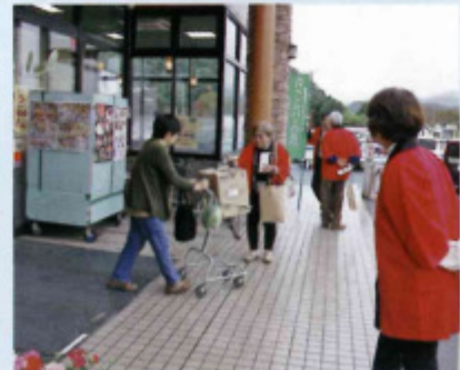
イオン福知山店での啓発