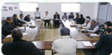
昨年の懇談会の様子