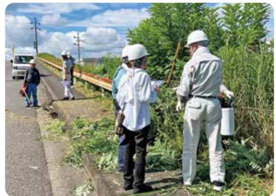
7月26日(金) パトロールの様子

「安全は無理せず 焦らず 油断せず」(全国统一安全就業スローガン、令和5年度～令和7年度)「大丈夫 その慢心が 命取り」(緊急スローガン)を心がけて事故のない安全就業を皆で推進しましょう。