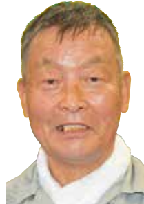
まき かわる 牧 変

⑤ カラオケ、スコップ三味線 ⑥ KTR宮福線3駅、駅前広場清掃、シルバーショップ(サロン) ⑦ 介護施設で長い間仕事をさせていただき、勉強になりました。今までの日帰り旅行、一泊旅行、楽しかったです。