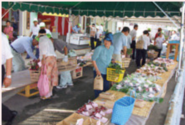
買物客で混雑する店内

ショップを開設して早くも2年9か月、開店回数は40回になろうとしています。運営委員や部員の皆さんの努力で、出品会員、品種・品数はもちろんのこと、購入者も会員にとどまらず、ご近所や町中からも来店者が増えています。おかげで回を重ねるごとに売り上げも伸び、シルバーショップが地域に定着してきた証しです。