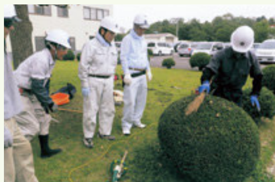
剪定の講習会風景