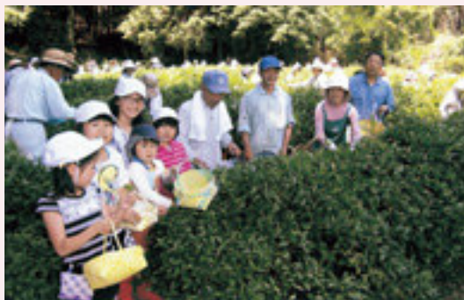
学校茶園での茶摘み

毎年、5月の学校茶園での茶摘み、8月の校庭・グラウンドの除草作業に参加をしています。