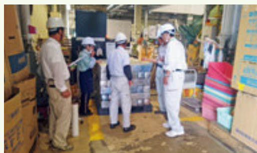
環境パーク内作業の確認