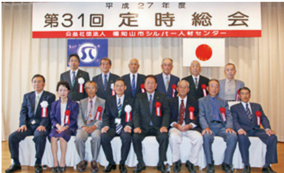
表彰を受けられた皆様