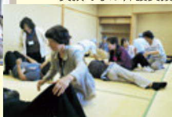
実技で学ぶ介護支援