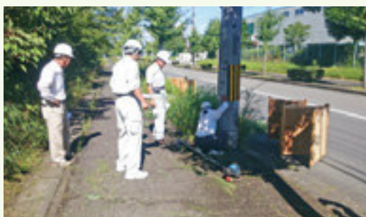
道路維持班の作業を点検

今年度1回目の安全パトロールを実施しました。決められたことを確実にやり、安全作業を徹底しましょう。