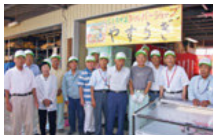
スタッフ用帽子を新調

少しの量でも構いませんので、会員の皆さんは、こぞって出品いただくようお願いします。