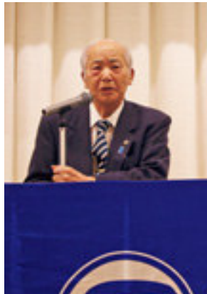
松山正治福知山市長