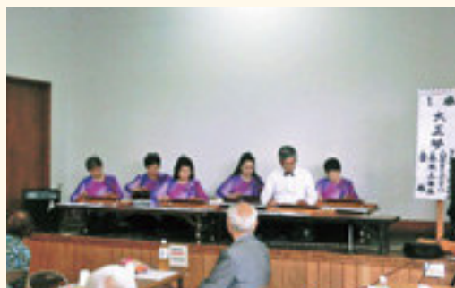
互助会大正琴同好会