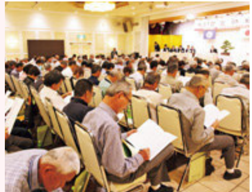
報告事項に聞き入る出席会員