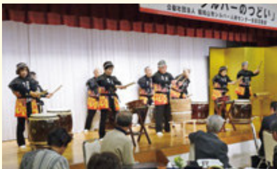
練習の成果を披露するメンバー

新しい曲にも挑戦し、シルバーの行事や地域、老人会などからの出演依頼も増え、シルバーの社会活動の一環として活動の幅を広げています。