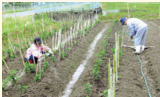
菊苗の世話をする三和地域の会員

今年からは、花の栽培に特化し、次のシルバー活動につながるよう地域の会員が頑張っています。