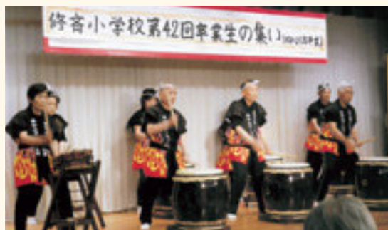
企画提案型事業“シルバー太鼓の演奏”

培った趣味と芸、磨いた演奏の腕前を披露し、多くの人に喜んでもらえることはとても幸せなことです。今後も頑張って自分を磨き続けましょう。