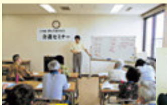
真剣に講義を受ける受講者

介護支援としての家事援助や移動補助などの一般的な学びをとおして、介護の基本や介護でありがちな感染症、認知症の対応、さらには実技による体位の変換や衣服の着脱補助の対応などについて学びました。