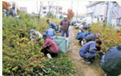
昨年の市民病院清掃風景