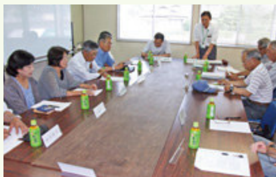
第1回適正就業推進委員会

平成27年6月24日に第1回適正就業推進委員会を開催し、今年度の取組方針の確認と重点項目を決定した。