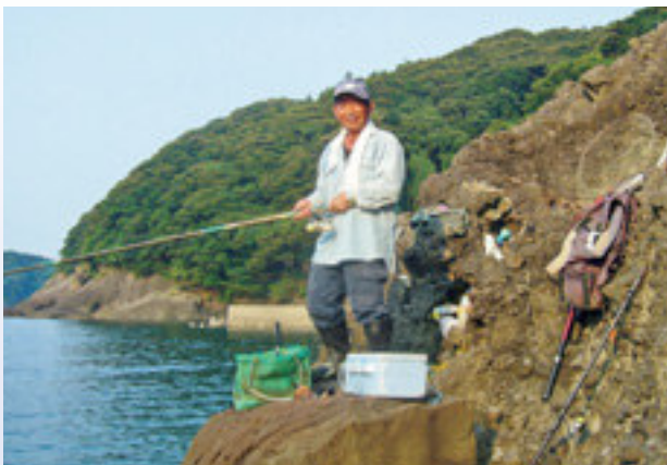
大物を狙い、自慢の竿を出す筆者。シルバーの帽子が年季を物語っています。

刺身にして娘夫婦に持っていくと喜んでくれ、また釣りに行こうという張り合いも出てきます。家では刺身や煮つけにして食べると最高です。何はともあれ、釣りは私にとつて一番の生きがいです。シルバーは二番です。