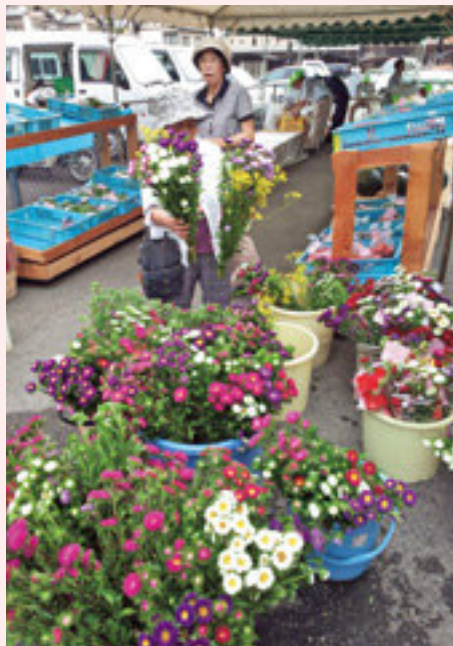
人気の高いお盆の“お花”

開店と同時に待ちかねたお客様が一斉に店内へ入られて、たくさんのお買いものをしていただいています。