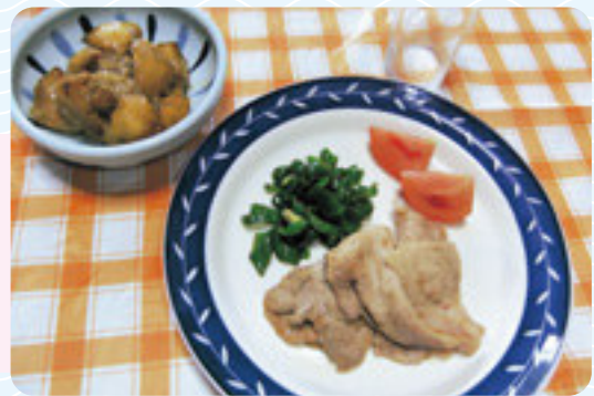
盛り付けされた じゃがいもの揚げ煮 (写真左上小鉢) 豚肉の生姜焼き (写真右平皿)