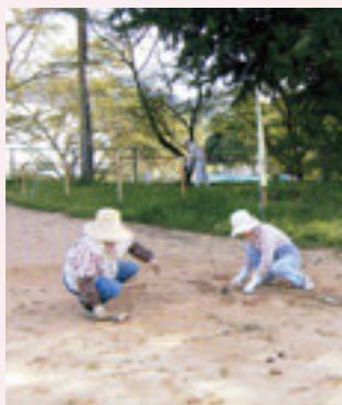
グラウンドの除草作業