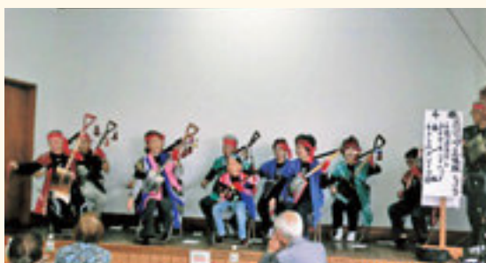
有志によるスコップ三味線