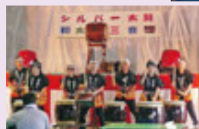
企業の夏祭りでの演奏 (長田野 扶桑化学)