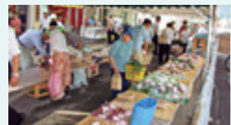
人・ものでにぎわうショップ

里山事業の生産品やシルバー農園の生産品、さらには、正月用しめなわ製作品の販売と合わせて一層の活況が生まれるものと期待されています。