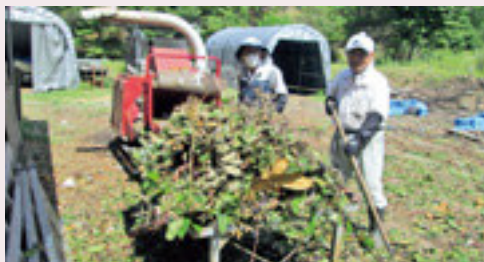
持ち込まれた剪定くすとチップ化作業

今後は、チップを除く竹炭、しいたけ、割木等をシルバーショップ事業の販売品に位置づけ、生産から販売までをショップで事業展開することとしました。