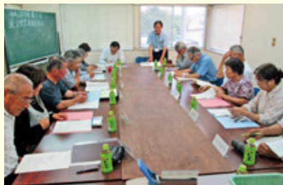
適正就業推進委員会