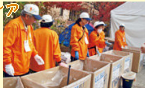
第24回マラソン大会での活動