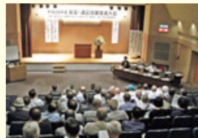
平成28年度 府安全・適正就業推進大会