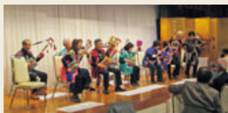
第8回「シル バーのつどい」 スコープ三味線