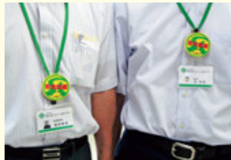
安全就業啓発ワッペン