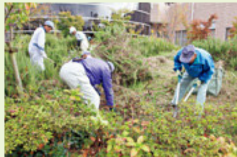
平成27年度の市民病院清掃除草