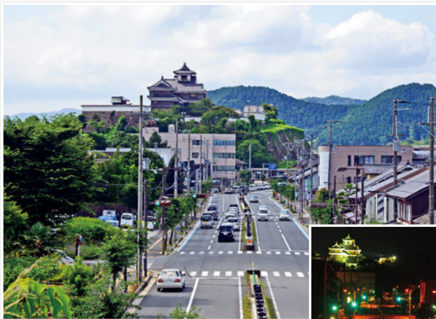
音無瀬橋西詰広小路より城下通り、福知山城を望む