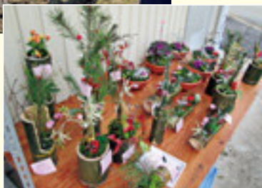
好評の正月用 寄せ植え