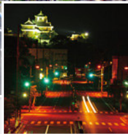
夜の城下通りと福知山城

昔の京街道は都市計画により4車線に拡幅されて、主要地方道舞鶴福知山線（通称 城下通り）となり、市街地の混雑緩和に大きく貢献しています。