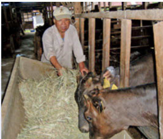
子牛の世話をする筆者