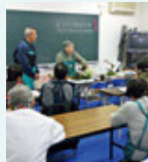
サロン部 苔玉作り教室