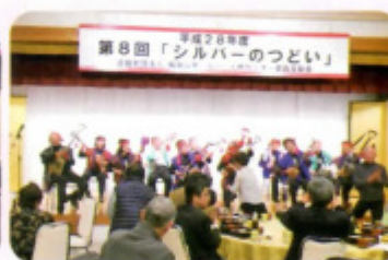
第8回「シルバーのつどい」 福知山市シルバー太鼓・スッコップ三味線