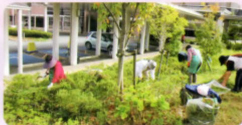
平成28年度の井ノ奥公園・市民病院清掃作業