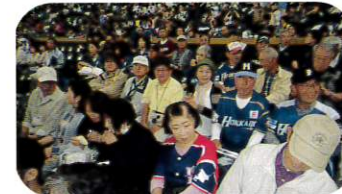
9月22日 初秋の交流会