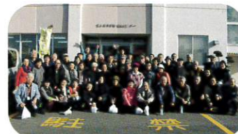
11月27日 晩秋の旅行会