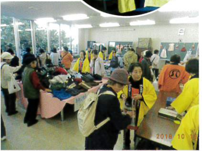
ゆったり展示 リフォーム作品