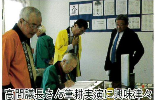
高間議長さん筆耕実演に興味津々