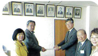
9月21日 議長へ予算要望