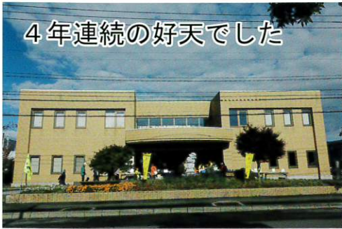
4年連続の好天でした