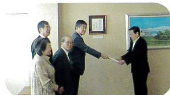
9月21日 市長へ予算要望