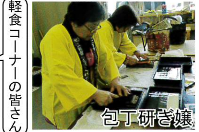
軽食コーナーの皆さん