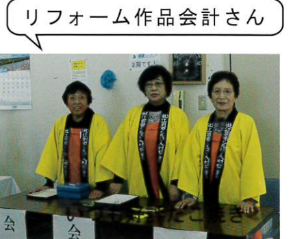
リフォーム作品会計さん