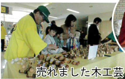
売れました木工芸