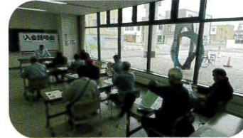
6月28日 出前入会説明会