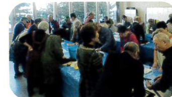
12月3日 刃物研ぎ講習会