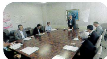
9月26日 伊達市 SC 視察来所