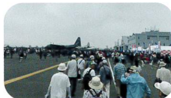
7月22日 真夏の旅行会