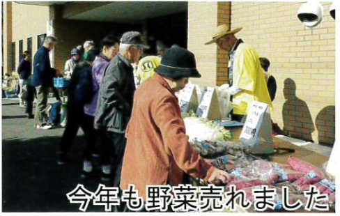
今年も野菜売れました