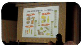
2月2日 安全衛生研修会