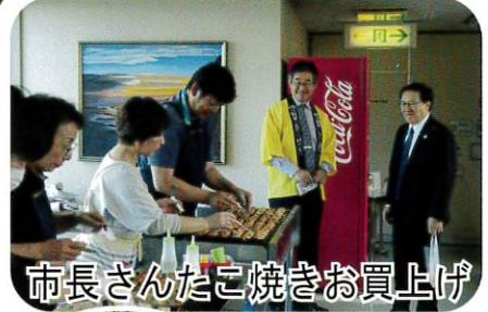
市長さんたこ焼きお買上げ