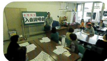
9月28日 女性限定入会説明会