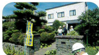
7月12日 安全パトロール