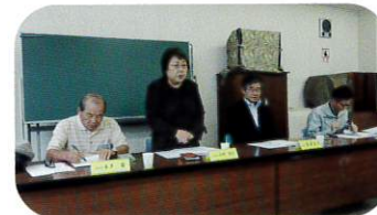
9月10日 まつり実行委員会