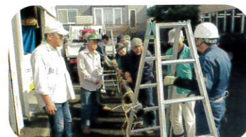
10月9日 冬囲い講習会