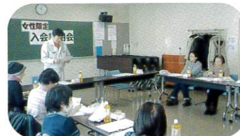
2月21日 女性限定入会説明会