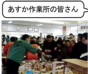
あすか作業所の皆さん