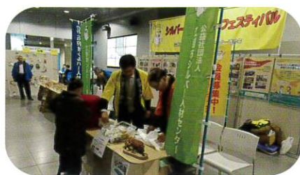
2月20日 チカホシルバーフェスティバル