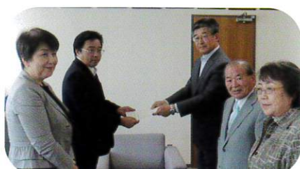
9月28日 議長へ予算要望