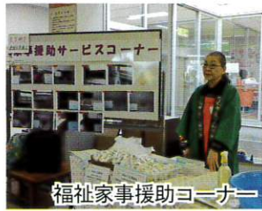
福祉家事援助コーナー