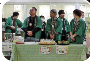
堆肥腐葉土販売受付