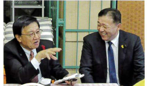
市長さんと星道議