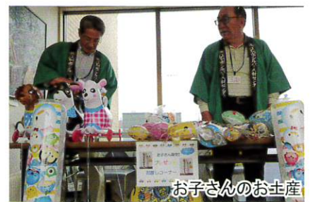
お子さんのお土産