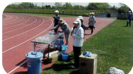
5月18日 野幌マラソンボランティア