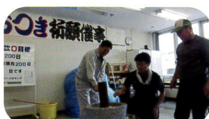
12月20日 安全祈願餅つき大会