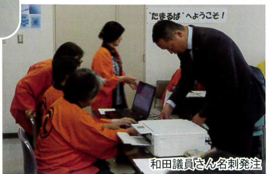
和田議員さん名刺発注