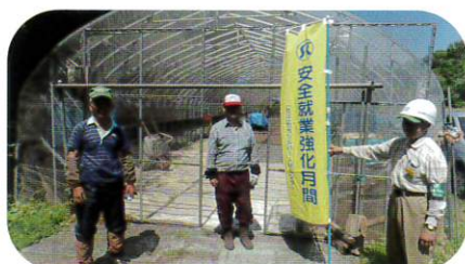
7月9日 安全パトロール