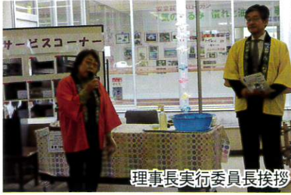
理事長実行委員長挨拶