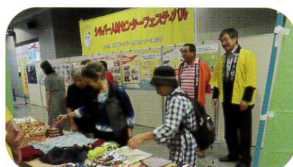
8月26日 チカホシルバーフェスティバル