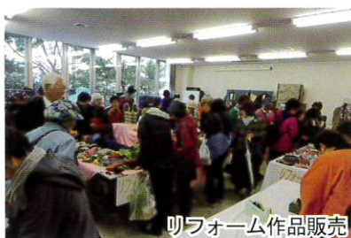
吹上フォーム作品販売