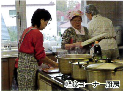
軽食コーナー厨房