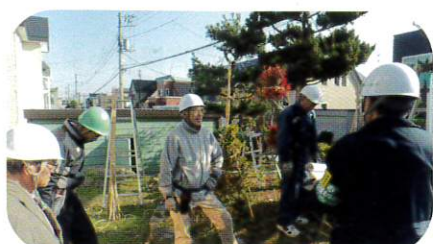
11月13日 安全パトロール