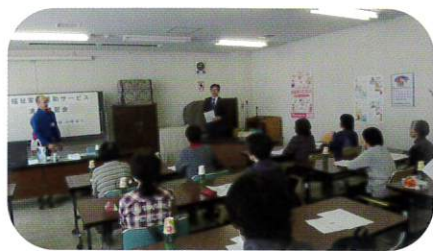
2月14日 家事支援清掃講習会