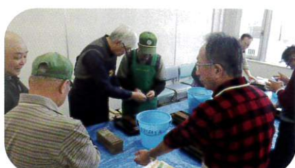
12月16日 刃物研ぎ講習会