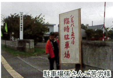
駐車場係さんご苦労様