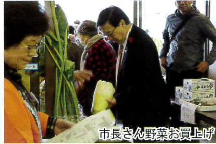
市長さん野菜お買上げ