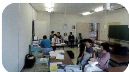
8月29日 派遣会員健康診断