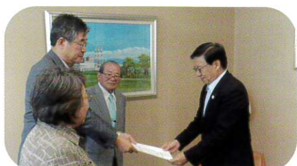
9月26日 市長へ予算要望