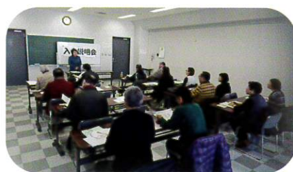
3月7日 出前入会説明会