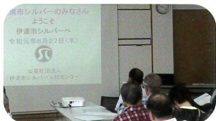
6月27日 旅行会ファイナル伊達市SC