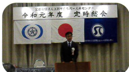
6月7日 センター定時総会