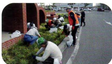
8月31日 野幌草取りボランティア