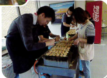
たこ焼きお兄さん