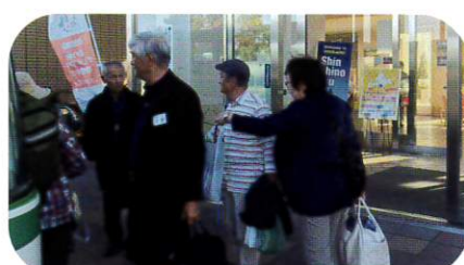
9月25日 新篠津村視察研修会