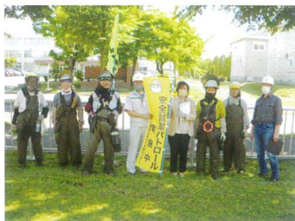
7月4日 安全パトロール