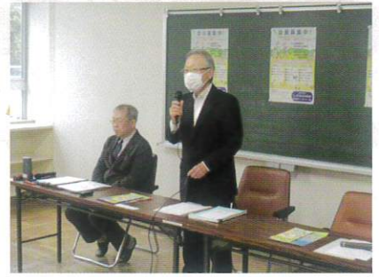
11月20日 研修旅行 (小樽市シルバー人材センター)①