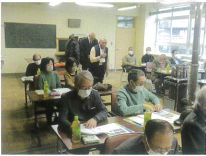
11月20日 研修旅行 (小樽市シルバー人材センター)②