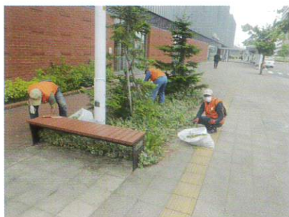
6月24日 草取りボランティア②