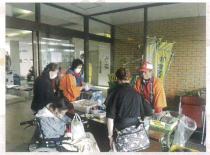
10月14日 第26回シルバーまつり③