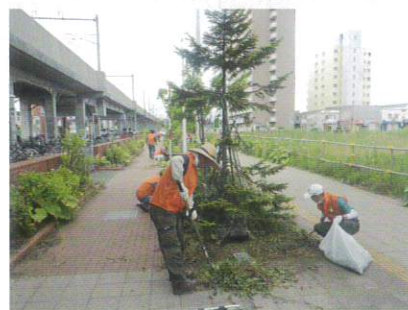
6月24日 草取りボランティア①