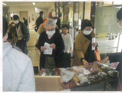
10月14日 第26回シルバーまつり②