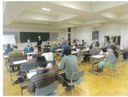
11月29日 地区懇談会 (大麻会場)