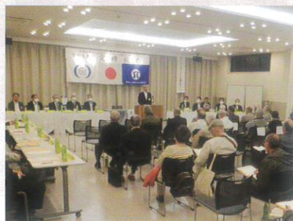
6月9日 定時総会 (市長あいさつ)