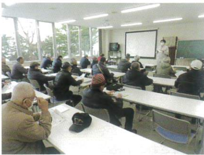
11月29日 福祉除雪説明会