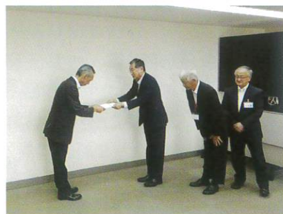
9月21日 市長予算要望