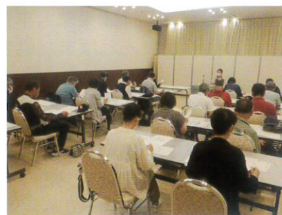
6月26日 道シ連就業体験入会説明会