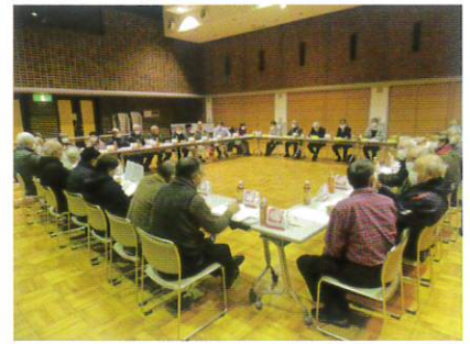
11月30日 地区懇談会 (江別会場)