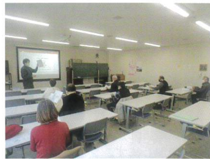
12月6日 第9回入会説明会