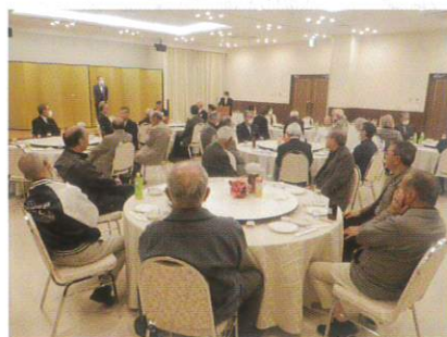
6月9日 会員懇親会 (来賓あいさつ)