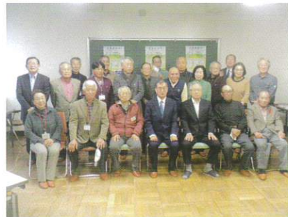
11月20日 研修旅行 (小樽市シルバー人材センター)③