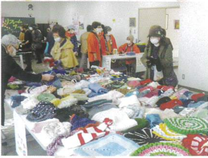
10月14日 第26回シルバーまつり④