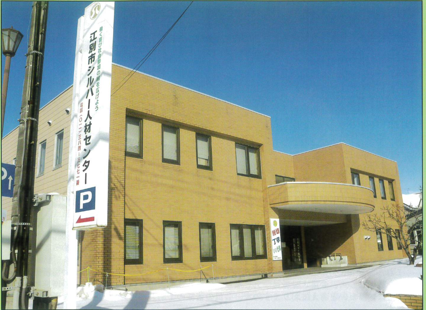
江別市シルバー人材センター(江別市ふれあいワークセンター)