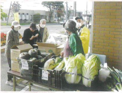
10月14日 第26回シルバーまつり①