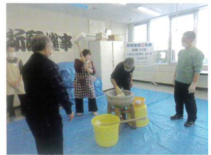
12月20日 安全祈願餅つき大会