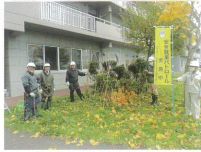
11月8日 安全パトロール