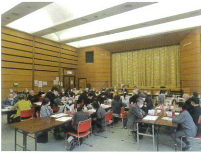
11月28日 地区懇談会 (野幌会場)