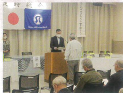
6月9日 定時総会 (会員表彰)