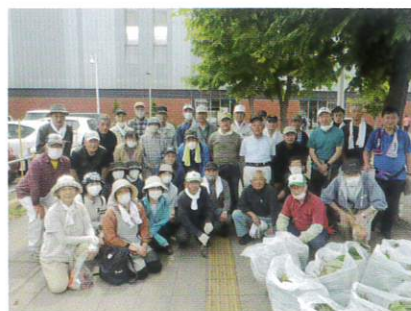
6月24日 草取りボランティア③