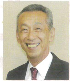
江別市長 後藤 好人