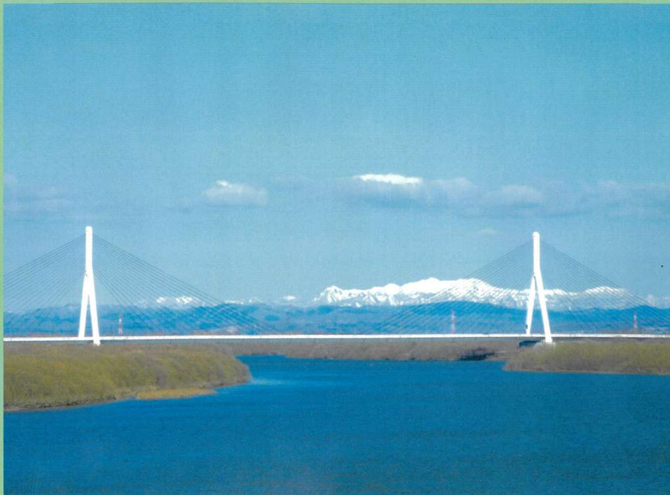
春の美原大橋