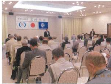
6月7日 センター一定時総会