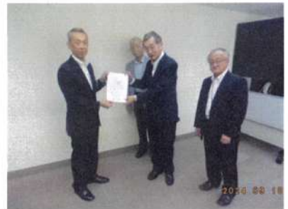
9月18日 市長予算要望