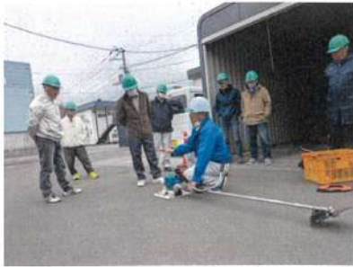
4月19日 刈払機取扱作業者講習会