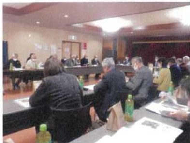
11月25日 研修旅行(富良野市シルバー人材センター)