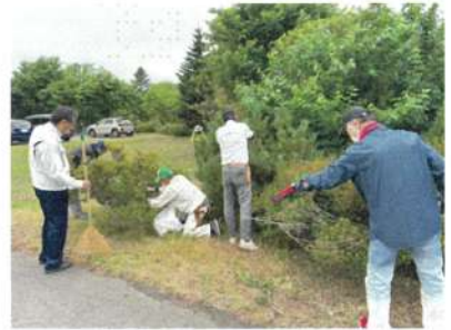
6月26日 技能(剪定)講習