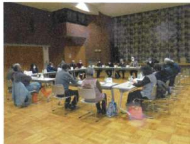
12月12日 地区懇談会(コミュニティセンター)