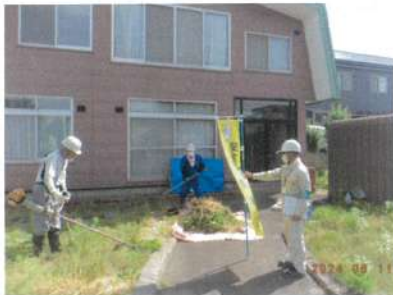
7月11日 安全パトロール