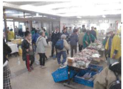
10月19日 シルバーまつり