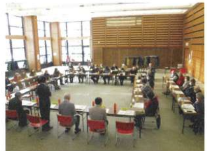
12月17日 地区懇談会(野幌公民館)