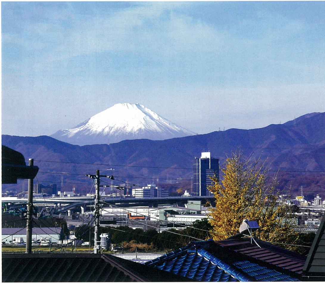
“海老名から初春の霊峰富士を望む”