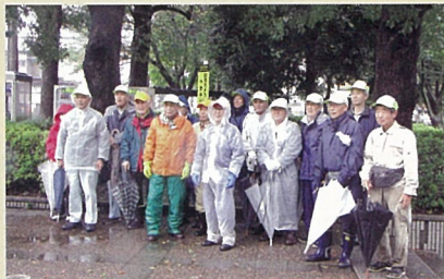
東柏ヶ谷近隣公園～さがみ野中央病院～さくら並木通り方面