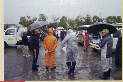
海老名市役所～厚木駅方面～中央公園方面