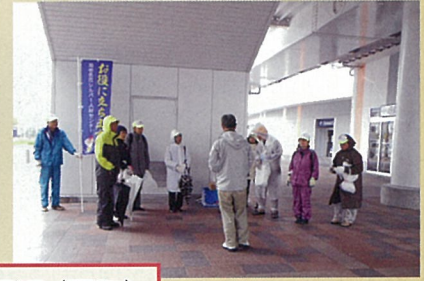
海老名駅西口えび～にや像前～ららぽーと周辺 (扇町)