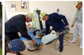
ポリッシャー講習会