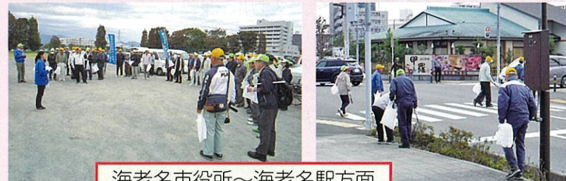
海老名市役所～海老名駅方面 ～中央公園方面～厚木駅方面

シルバーの日と称した地域の美化清掃を毎年実施していますが、当日は70名程の会員や役員が参加し行われました(10月23日(火))。また、新たにシルバー人材センターの活動を紹介しますパネル展示を市役所1Fエントランスホールで行いました(10月23日(火)から4日間)。