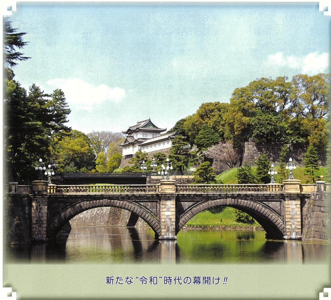
新たな“令和”時代の幕開け!!