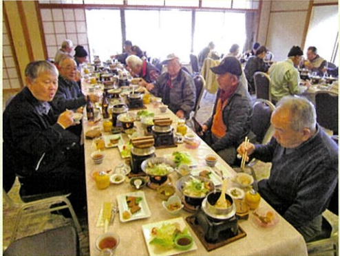
□楽しみにしていた長瀬でのランチタイム