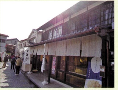
□小江戸(菓子屋横丁)①