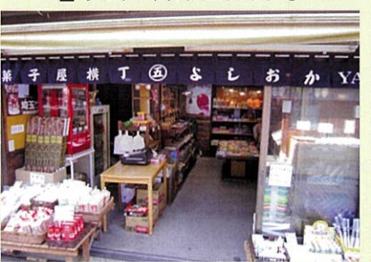
□小江戸(菓子屋横丁)②