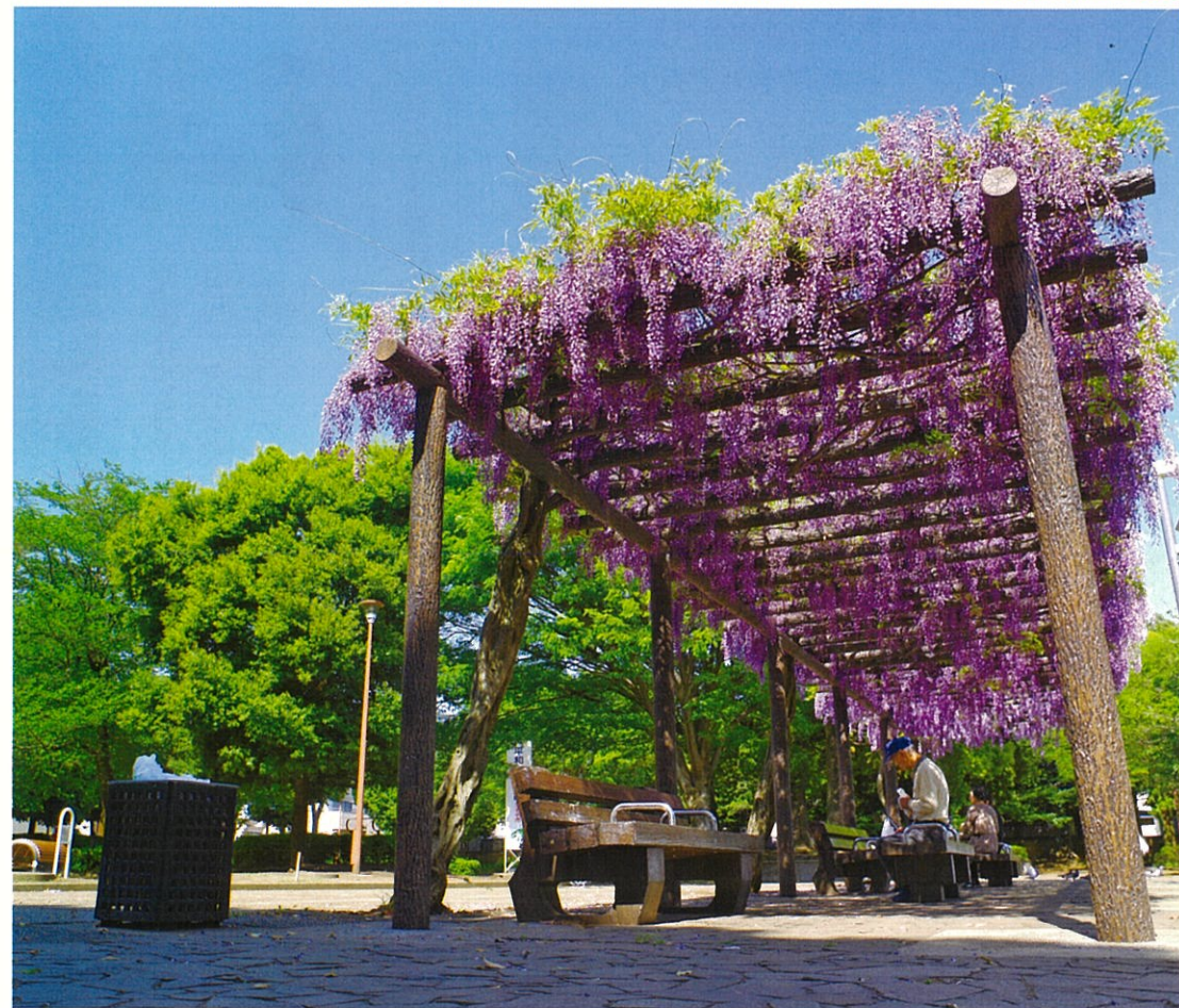
“風薫る五月の東柏ヶ谷近隣公園”